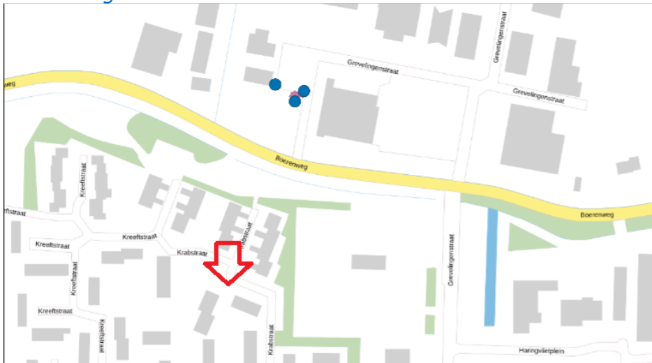
Figuur 2: Weergave van het Antenneregister.

Bovenstaande afbeelding (figuur 2) is de weergave van het Antenneregister van de omgeving waar de EMV-meting heeft plaatsgevonden. In de weergave van het Antenneregister zijn een aantal gekleurde iconen zichtbaar. Deze iconen geven de opstelplaatsen van de verschillende antenne-installaties weer. Donkerblauw gekleurde iconen geven opstelplaatsen ten behoeve van mobiele communicatie (2G, 3G, 4G en 5G) weer. De paarse iconen zijn vaste verbindingen, ook wel point-to-point verbindingen genoemd. De signalen van vaste verbindingen zijn niet meegenomen in de metingen, omdat deze niet voorkomen op meetlocaties op de grond. Daarnaast worden de frequenties die vaste verbindingen gebruiken met andere meetapparatuur gemeten.