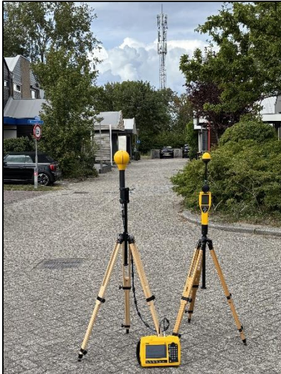
Figuur 1: Foto van de breedbandige outdoor meetopstelling.

Op de foto hierboven (figuur 1) is de breedbandige outdoor meetopstelling te zien. Het meetapparaat staat aan de Krabstraat te Zierikzee. Op de achtergrond staat de dichtstbijzijnde vast opgestelde antenne-installatie.