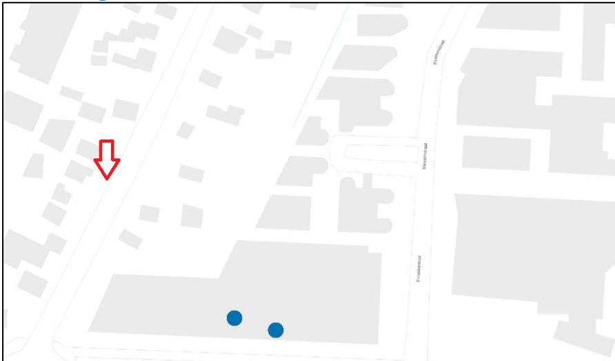
Figuur 2: Weergave van het Antenneregister.

Bovenstaande afbeelding (figuur 2) is de weergave van het Antenneregister van de omgeving waar de EMV-meting heeft plaatsgevonden. In de weergave van het Antenneregister zijn een aantal gekleurde iconen zichtbaar. Deze iconen geven de opstelplaatsen van de verschillende antenne-installaties weer. Donkerblauw gekleurde iconen geven opstelplaatsen ten behoeve van mobiele communicatie (2G, 3G, 4G en 5G) weer. De signalen van vaste verbindingen zijn niet meegenomen in de metingen, omdat deze niet voorkomen op meetlocaties op de grond. Daarnaast worden de frequenties die vaste verbindingen gebruiken met andere meetapparatuur gemeten.