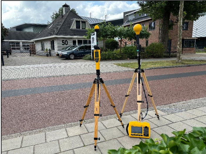
Figuur 1: Foto van de breedbandige outdoor meetopstelling.

Op de foto hierboven (figuur 1) is de breedbandige outdoor meetopstelling te zien. Het meetapparaat staat aan de Stationsstraat te Veenendaal. Op de achtergrond staat de dichtstbijzijnde vast opgestelde antenne-installatie.