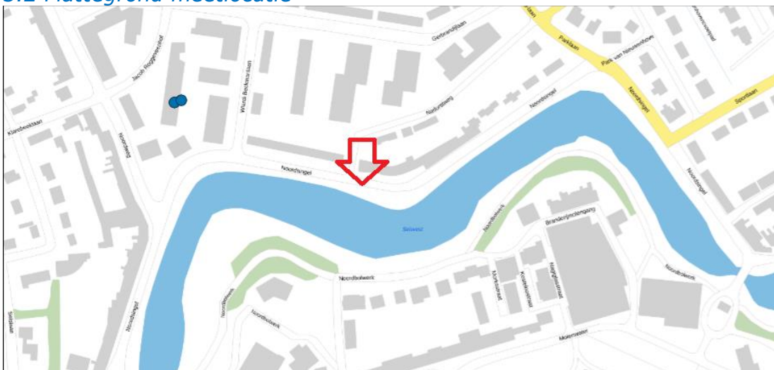
Figuur 2: Weergave van het Antenneregister.

Bovenstaande afbeelding (figuur 2) is de weergave van het Antenneregister van de omgeving waar de EMV-meting heeft plaatsgevonden. In de weergave van het Antenneregister zijn een aantal gekleurde iconen zichtbaar. Deze iconen geven de opstelplaatsen van de verschillende antenne-