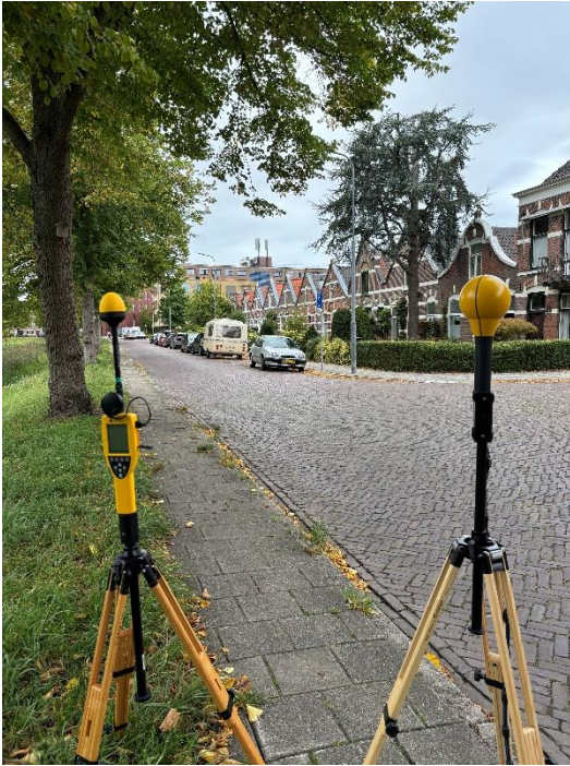
Figuur 1: Foto van de breedbandige outdoor meetopstelling.

Op de foto hierboven (figuur 1) is de breedbandige outdoor meetopstelling te zien. Het meetapparaat staat aan de Noordsingel te Middelburg. Op de achtergrond staat de dichtstbijzijnde vast opgestelde antenne-installatie.