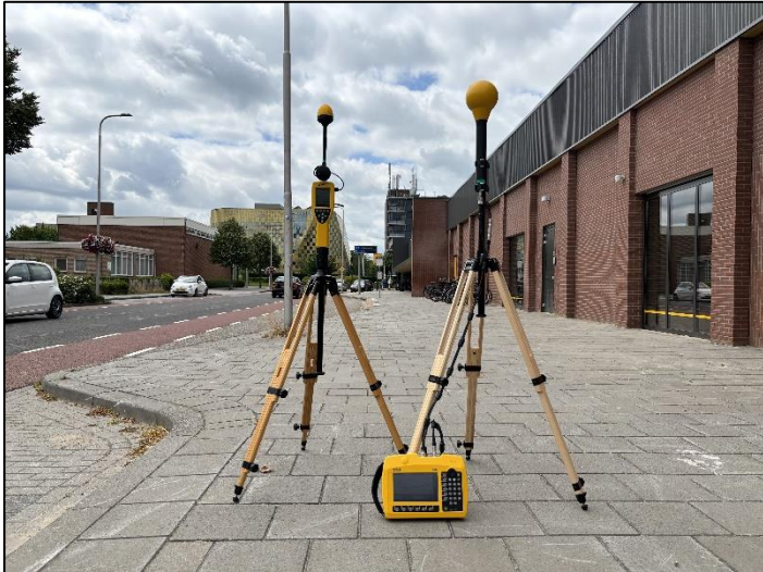
Figuur 1: Foto van de breedbandige outdoor meetopstelling.

Op de foto hierboven (figuur 1) is de breedbandige outdoor meetopstelling te zien. Het meetapparaat staat aan de Witte de Withstraat te Hardenberg. Op de achtergrond staat de dichtstbijzijnde vast opgestelde antenne-installatie.