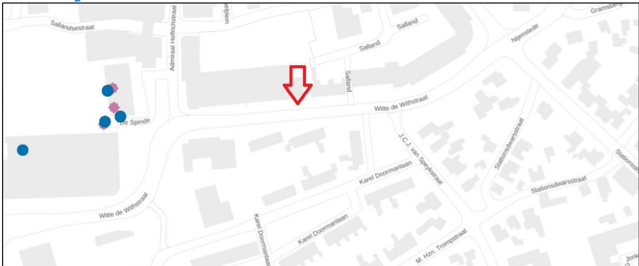
Figuur 2: Weergave van het Antenneregister.

Bovenstaande afbeelding (figuur 2) is de weergave van het Antenneregister van de omgeving waar de EMV-meting heeft plaatsgevonden. In de weergave van het Antenneregister zijn een aantal gekleurde iconen zichtbaar. Deze iconen geven de opstelplaatsen van de verschillende antenne-installaties weer. Donkerblauw gekleurde iconen geven opstelplaatsen ten behoeve van mobiele communicatie (2G, 3G, 4G en 5G) weer. De paarse iconen zijn vaste verbindingen, ook wel point-to-point verbindingen genoemd. De signalen van vaste verbindingen zijn niet meegenomen in de metingen, omdat deze niet voorkomen op meetlocaties op de grond. Daarnaast worden de frequenties die vaste verbindingen gebruiken met andere meetapparatuur gemeten.