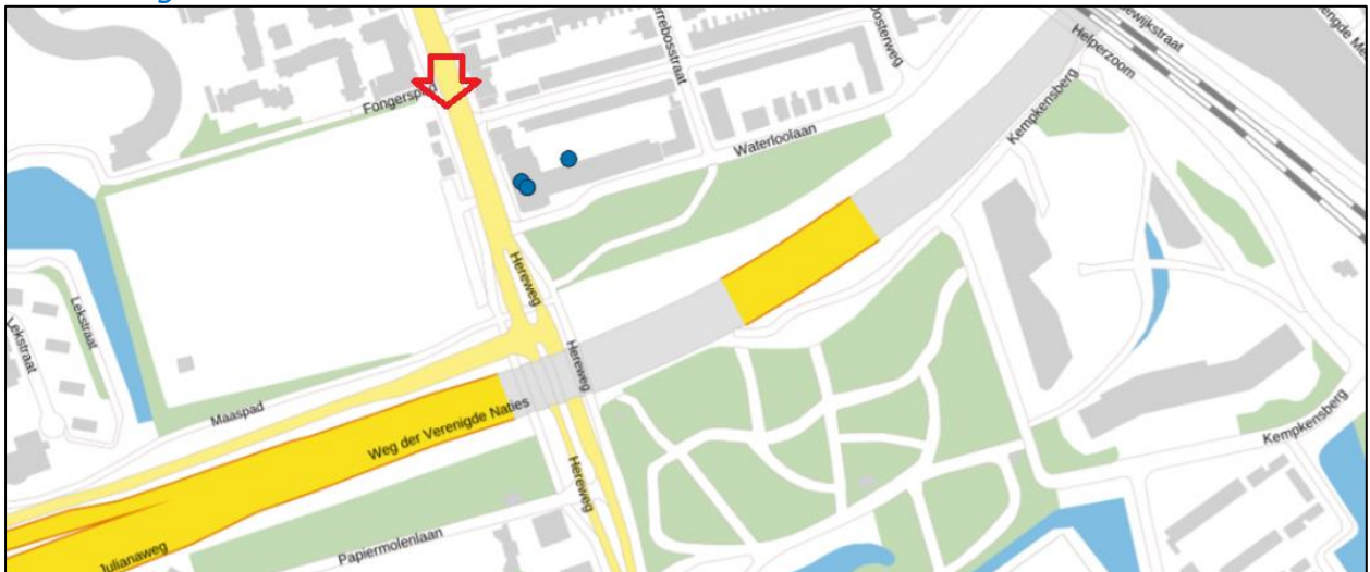
Figuur 2: Weergave van het Antenneregister.

Bovenstaande afbeelding (figuur 2) is de weergave van het Antenneregister van de omgeving waar de EMV-meting heeft plaatsgevonden. In de weergave van het Antenneregister zijn een aantal gekleurde iconen zichtbaar. Deze iconen geven de opstelplaatsen van de verschillende antenne-installaties weer. Donkerblauw gekleurde iconen geven opstelplaatsen ten behoeve van mobiele communicatie (2G, 3G, 4G en 5G) weer. De signalen van vaste verbindingen zijn niet meegenomen in de metingen, omdat deze niet voorkomen op meetlocaties op de grond. Daarnaast worden de frequenties die vaste verbindingen gebruiken met andere meetapparatuur gemeten.