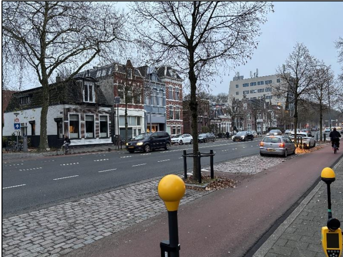
Figuur 1: Foto van de breedbandige outdoor meetopstelling.

Op de foto hierboven (figuur 1) is de breedbandige outdoor meetopstelling te zien. Het meetapparaat staat aan de Hereweg te Groningen. Op de achtergrond staat de dichtstbijzijnde vast opgestelde antenne-installatie.