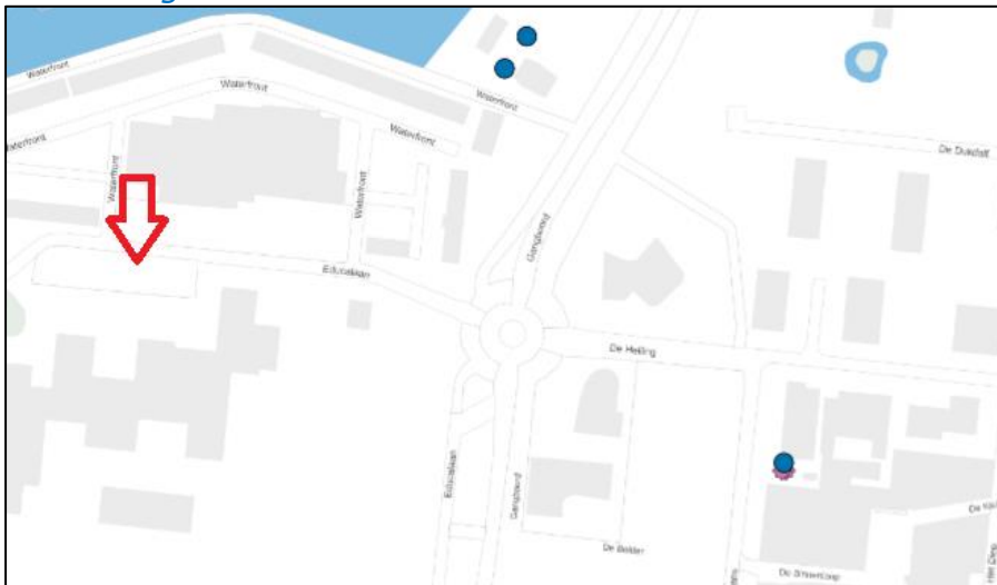
Figuur 2: Weergave van het Antenneregister.

Bovenstaande afbeelding (figuur 2) is de weergave van het Antenneregister van de omgeving waar de EMV-meting heeft plaatsgevonden. In de weergave van het Antenneregister zijn een aantal gekleurde iconen zichtbaar. Deze iconen geven de opstelplaatsen van de verschillende antenne-installaties weer. Donkerblauw gekleurde iconen geven opstelplaatsen ten behoeve van mobiele communicatie (2G, 3G, 4G en 5G) weer. De paarse iconen zijn vaste verbindingen, ook wel point-to-point verbindingen genoemd. De signalen van vaste verbindingen zijn niet meegenomen in de metingen, omdat deze niet voorkomen op meetlocaties op de grond. Daarnaast worden de frequenties die vaste verbindingen gebruiken met andere meetapparatuur gemeten.