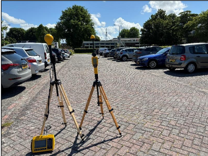
Figuur 1: Foto van de breedbandige outdoor meetopstelling.

Op de foto hierboven (figuur 1) is de breedbandige outdoor meetopstelling te zien. Het meetapparaat staat aan de Educalaan te Dronten. Op de achtergrond staat de dichtstbijzijnde vast opgestelde antenne-installatie.