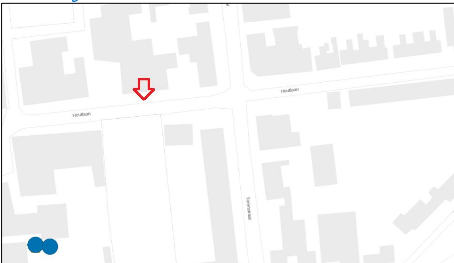
Figuur 2: Weergave van het Antenneregister.

Bovenstaande afbeelding (figuur 2) is de weergave van het Antenneregister van de omgeving waar de EMV-meting heeft plaatsgevonden. In de weergave van het Antenneregister zijn een aantal