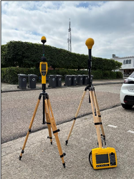
Figuur 1: Foto van de breedbandige outdoor meetopstelling.

Op de foto hierboven (figuur 1) is de breedbandige outdoor meetopstelling te zien. Het meetapparaat staat aan de Houtlaan te Drachten. Op de achtergrond staat de dichtstbijzijnde vast opgestelde antenne-installatie.