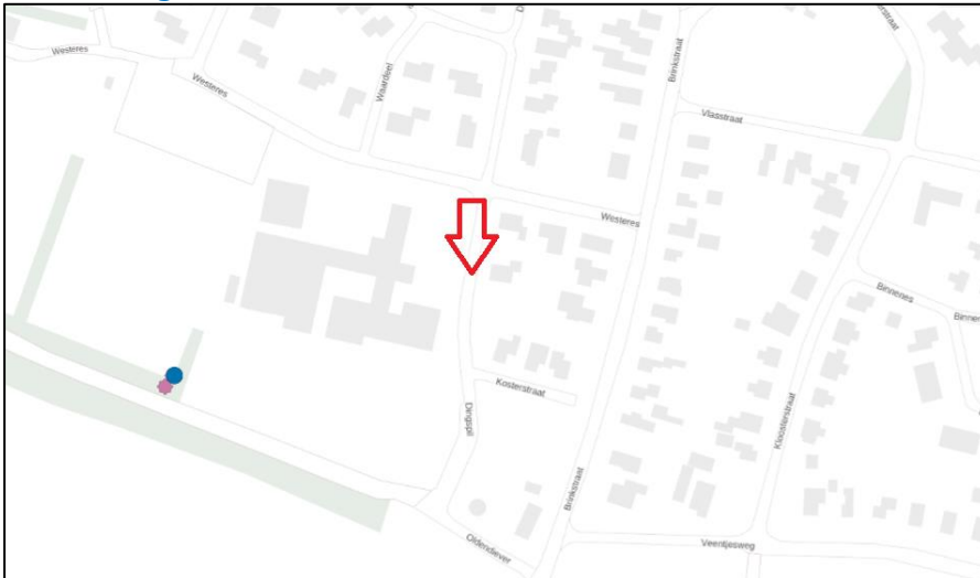
Figuur 2: Weergave van het Antenneregister.

Bovenstaande afbeelding (figuur 2) is de weergave van het Antenneregister van de omgeving waar de EMV-meting heeft plaatsgevonden. In de weergave van het Antenneregister zijn een aantal gekleurde iconen zichtbaar. Deze iconen geven de opstelplaatsen van de verschillende antenne-installaties weer. Donkerblauw gekleurde iconen geven opstelplaatsen ten behoeve van mobiele communicatie (2G, 3G, 4G en 5G) weer. De paarse iconen zijn vaste verbindingen, ook wel point-to-point verbindingen genoemd. De signalen van vaste verbindingen zijn niet meegenomen in de metingen, omdat deze niet voorkomen op meetlocaties op de grond. Daarnaast worden de frequenties die vaste verbindingen gebruiken met andere meetapparatuur gemeten.