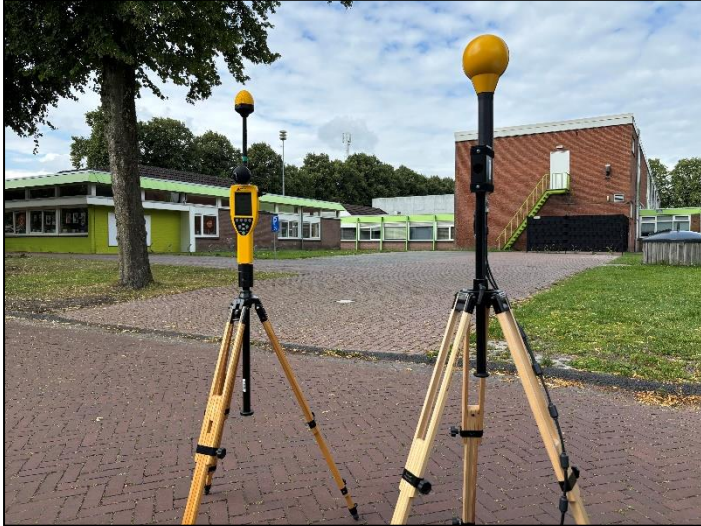
Figuur 1: Foto van de breedbandige outdoor meetopstelling.

Op de foto hierboven (figuur 1) is de breedbandige outdoor meetopstelling te zien. Het meetapparaat staat aan de Dingspil te Diever. Op de achtergrond staat de dichtstbijzijnde vast opgestelde antenne-installatie.