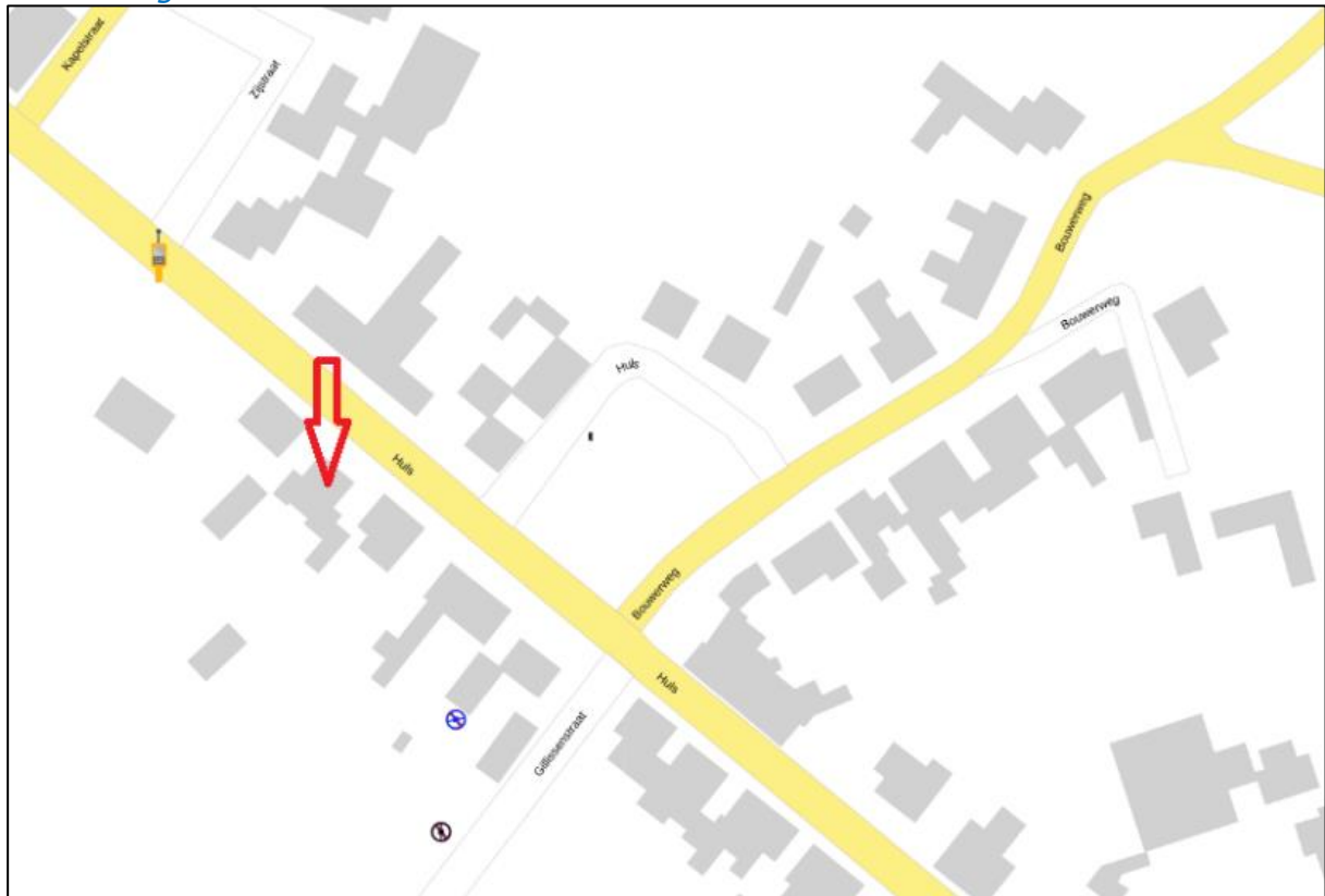
Figuur 1: Weergave van het Antenneregister

Bovenstaande afbeelding (figuur 1) is de weergave van het Antenneregister van de omgeving waar de EMV-meting heeft plaatsgevonden. In de weergave van het Antenneregister zijn een aantal gekleurde cirkels zichtbaar. Deze cirkels geven de opstelplaatsen van de verschillende antenne-installaties weer. Op de locatie met de zwarte, blauwe, bordeaux rode en paarse cirkels is 2G, 3G, 4G en 5G in gebruik. De rode cirkels zijn vaste verbindingen, ook wel point-to-point verbindingen genoemd. De signalen van vaste verbindingen zijn niet meegenomen in de metingen, omdat deze niet voorkomen op meetlocaties op de grond. Daarnaast worden de frequenties die vaste verbindingen gebruiken met andere meetapparatuur gemeten.