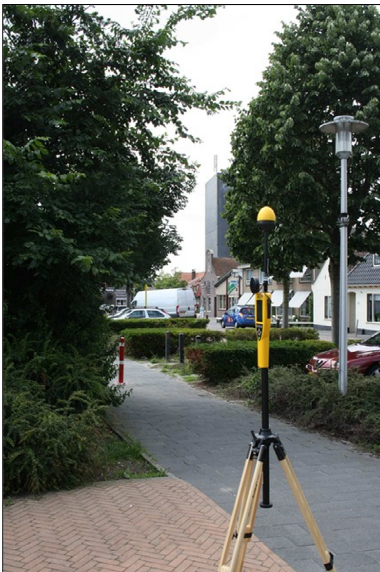
Foto 2; Meetopstelling openbare weg Koninginneweg thv. Breestraat, met op de achtergrond gebouw RODAKO waarop(aan) de GSM en UMTS antennes bevestigd zijn.

De meetonzekerheid van het gebruikte meetinstrument is maximaal -3,7 dB en +2,6 dB. Dit betekent dat de gemeten niveaus maximaal 35 % lager en 36 % hoger kunnen zijn dan de geregistreerde waarden.