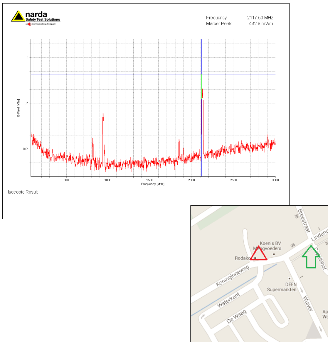
Figuur 2; De groene pijl geeft de meetlocatie aan. De rode driehoek geeft de locatie aan waar de GSM en UMTS antennes opgesteld staan. (Op het dak en tegen de gevel gebouw RODAKO)