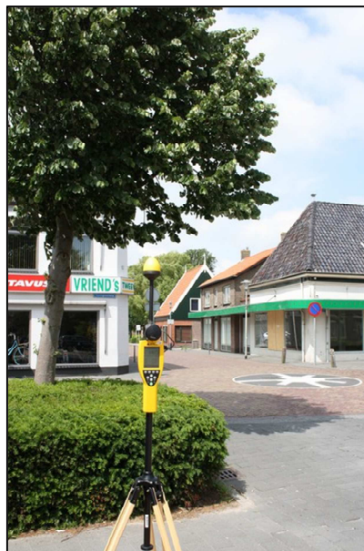
Foto 1: Meetopstelling kruising Koninginneweg – Breestraat te Opmeer.