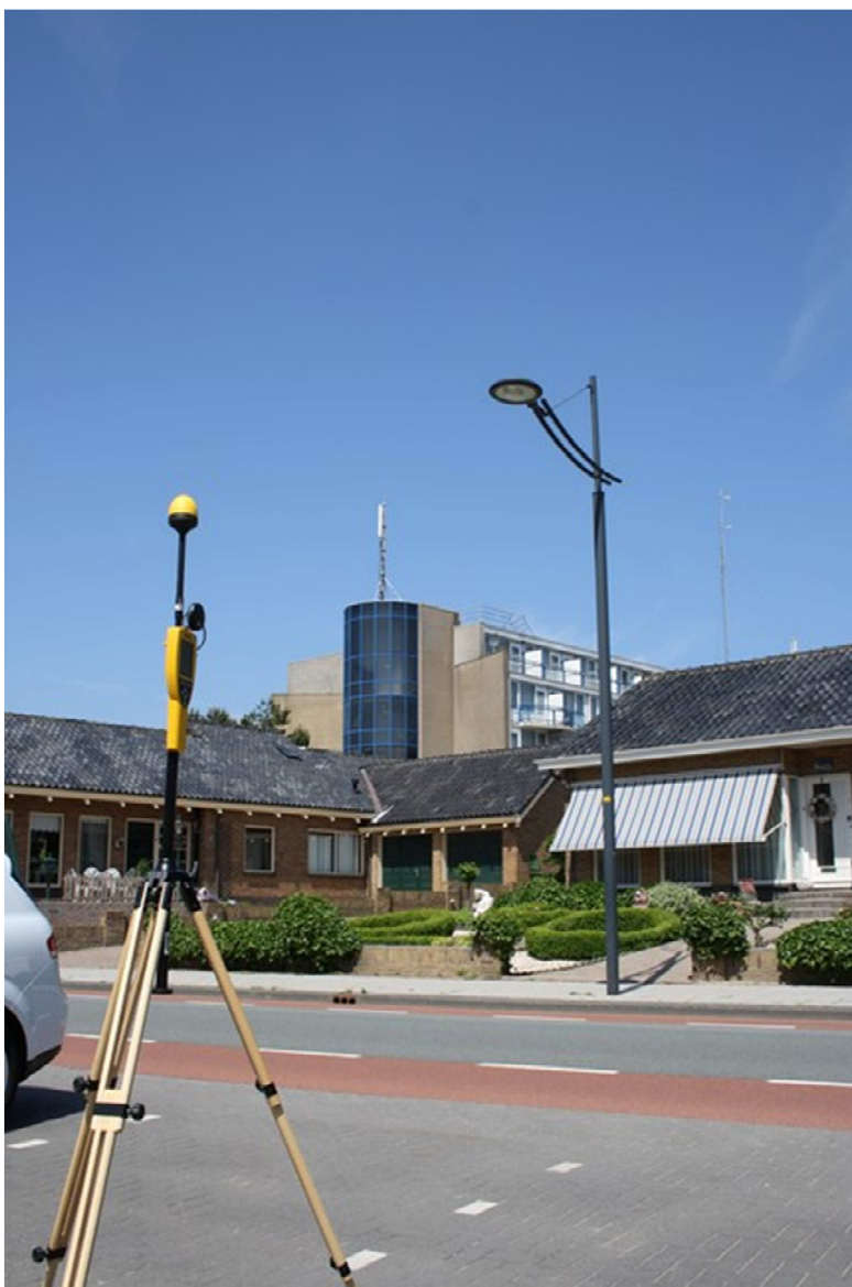
Foto 2; Meetopstelling openbare weg Zeeweg thv. Burg. Nielestraat, Egmond aan zee met op de achtergrond hotel Zuiderduin waarop de antennes voor GSM en FM-omroep zijn geplaatst.

De meetonzekerheid van het gebruikte meetinstrument is maximaal -3,7 dB en +2,6 dB. Dit betekent dat de gemeten niveaus maximaal 35 % lager en 36 % hoger kunnen zijn dan de geregistreerde waarden.