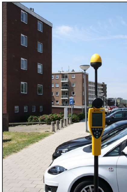
Foto 1: Meetopstelling Zeeweg thv. Burg. Nielestraat, op achtergrond flat Kennedyboulevard met LTE en UMTS antennes