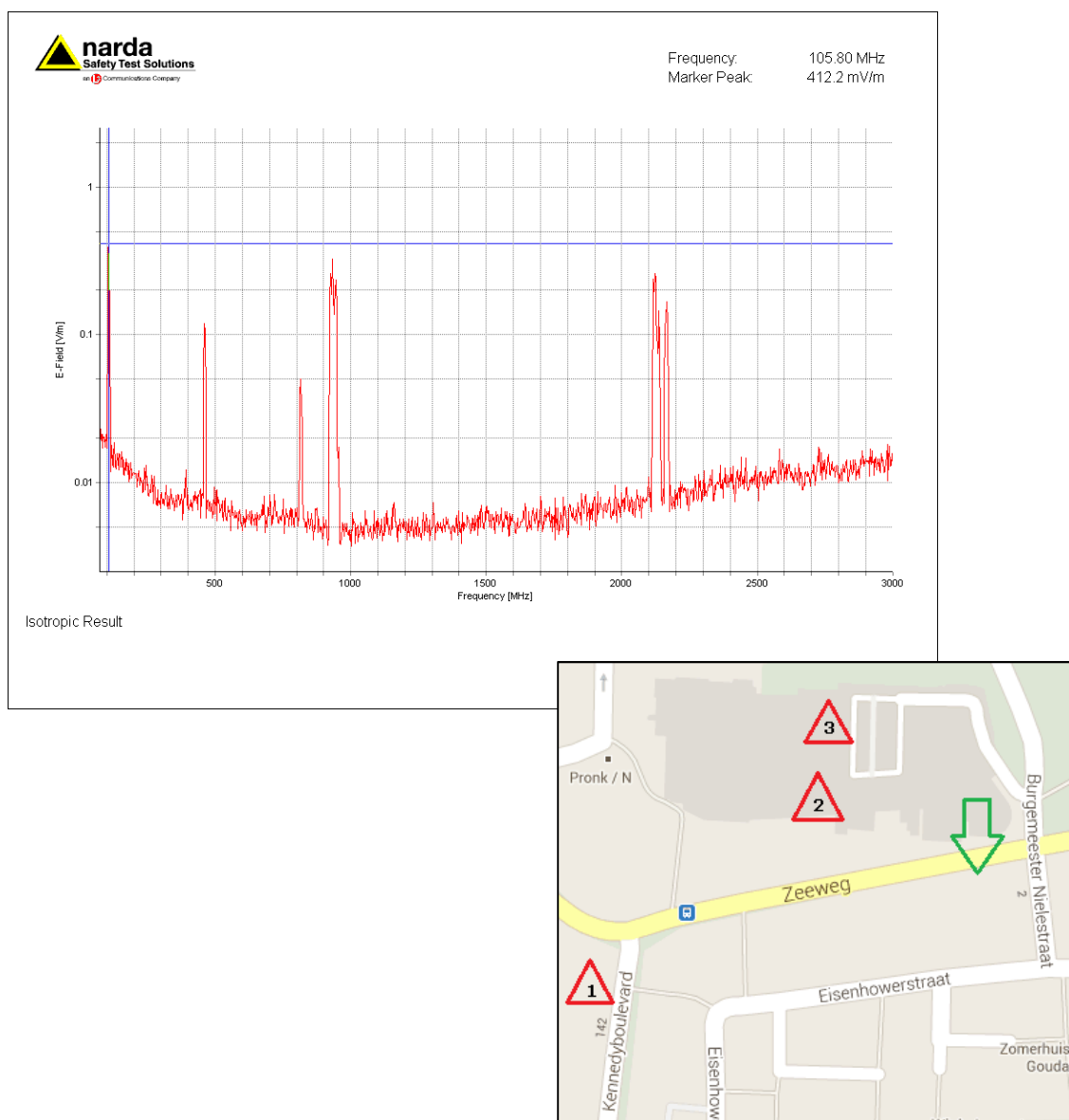
Figuur 2; De groene pijl geeft de meetlocatie aan. De rode driehoeken geven de locaties aan waar de LTE en UMTS (1) de GSM (2) en de FM-omroep (3) antennes opgesteld staan.