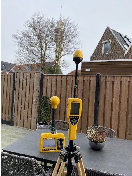
Figuur 1: Foto van de breedbandige outdoor meetopstelling in de tuin

Op de foto hierboven (figuur 1) is de breedbandige outdoor meetopstelling te zien. Het meetapparaat staat in de tuin aan de straat Abel Tasmanstraat in de plaats Wormerveer. Op de achtergrond staat de dichtstbijzijnde vast opgestelde antenne-installatie.