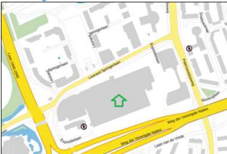
Figuur 2: Weergave van het Antenneregister

Bovenstaande afbeelding (figuur 2) is de weergave van het Antenneregister van de omgeving waar de EMV-meting heeft plaatsgevonden. In de weergave van het Antenneregister is een aantal gekleurde cirkels zichtbaar. Deze cirkels geven de opstelplaatsen van de verschillende antenne-installaties weer. Op de locatie met de zwarte, blauwe, bordeaux rode en paarse cirkels is 2G, 4G en 5G in gebruik.