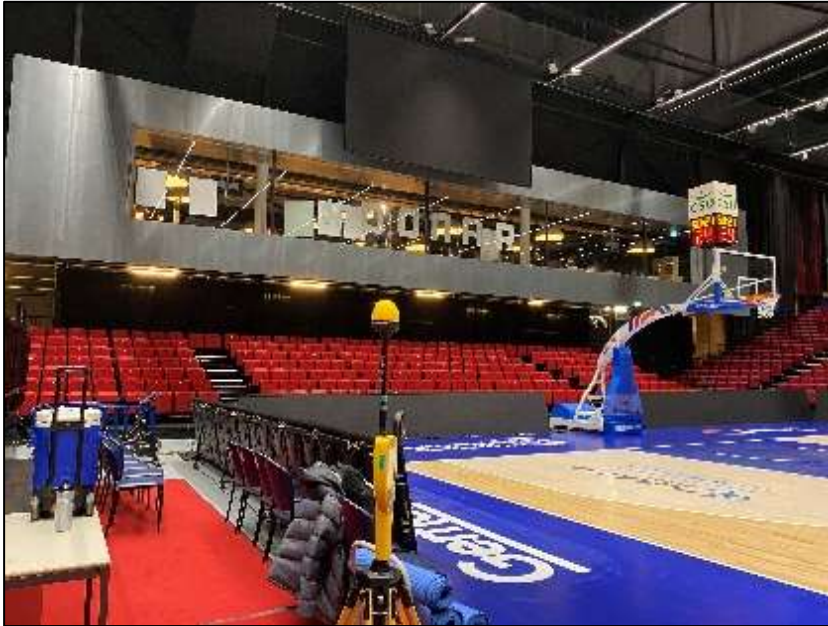
Figuur 1: Foto van de breedbandige outdoor meetopstelling.

Op de foto hierboven (figuur 1) is de breedbandige outdoor meetopstellingen te zien. Het meetapparaat staat in de Martini Plaza hal. De dichtstbijzijnde vast opgestelde antenne-installatie is vanuit de meetlocatie niet te zien.