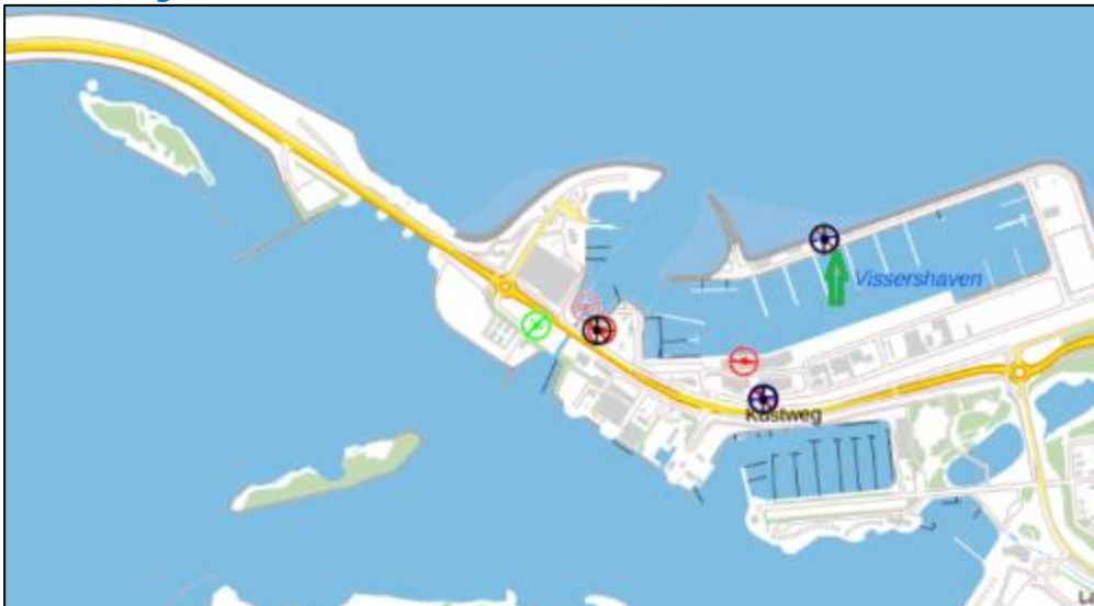
Figuur 3: Weergave van het Antenneregister

Bovenstaande afbeelding (figuur 3) is de weergave van het Antenneregister van de omgeving waar de EMV-meting heeft plaatsgevonden. In de weergave van het Antenneregister is een aantal gekleurde cirkels zichtbaar. Deze cirkels geven de opstelplaatsen van de verschillende antenne-installaties weer. Op de locatie met de zwarte, blauwe en bordeaux rode cirkels is 2G, 3G en 4G in gebruik. De rode cirkels zijn vaste verbindingen, ook wel point-to-point verbindingen genoemd. De signalen van vaste verbindingen zijn niet meegenomen in de metingen, omdat deze niet voorkomen op meetlocaties op de grond. Daarnaast worden de frequenties die vaste verbindingen gebruiken met andere meetapparatuur gemeten.