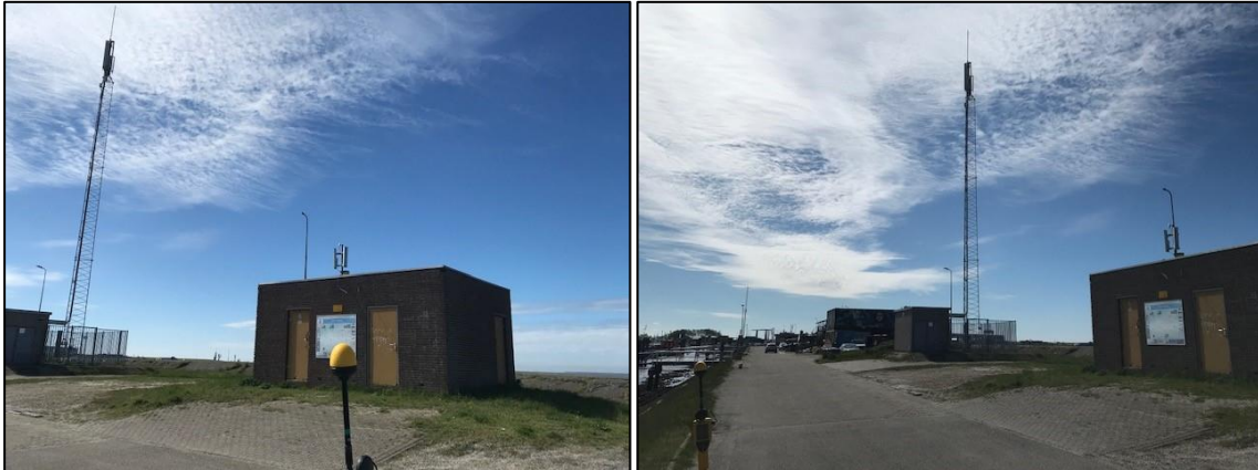
Figuur 1 en 2: Foto's van de breedbandige outdoor meetopstelling

Op de foto's hierboven (figuur 1 en 2) is de breedbandige outdoor meetopstelling te zien. Het meetapparaat staat op straat. Op de achtergrond staat de dichtstbijzijnde vast opgestelde antenne-installatie. De antenne op het huisje wordt gebruikt voor wifi.