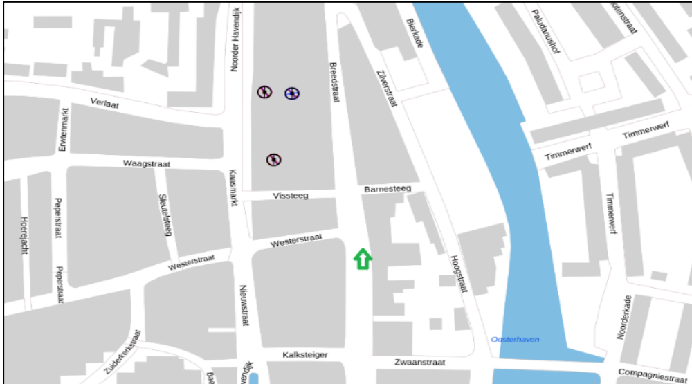
Figuur 3: Weergave van het Antenneregister

Bovenstaande afbeelding (figuur 3) is de weergave van het Antenneregister van de omgeving waar de EMV-meting heeft plaatsgevonden. In de weergave van het Antenneregister is een aantal gekleurde cirkels zichtbaar. Deze cirkels geven de opstelplaatsen van de verschillende antenne-installaties weer. Op de locatie met de zwarte, blauwe, bordeaux rode en paarse cirkels is 2G, 3G, 4G en 5G in gebruik. De licht rode cirkels zijn vaste verbindingen, ook wel point-to-point verbindingen genoemd. De signalen van vaste verbindingen zijn niet meegenomen in de metingen, omdat deze niet voorkomen op meetlocaties op de grond. Daarnaast worden de frequenties die vaste verbindingen gebruiken met andere meetapparatuur gemeten.