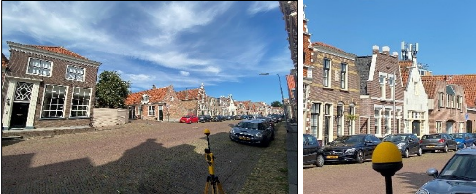
Figuur 1 en 2: Foto's van de breedbandige outdoor meetopstelling.

Op de foto's hierboven (figuur 1 en 2) is de breedbandige outdoor meetopstelling te zien. Het meetapparaat staat op straat. De dichtstbijzijnde vast opgestelde antenne-installatie is vanuit de meetlocatie te zien.