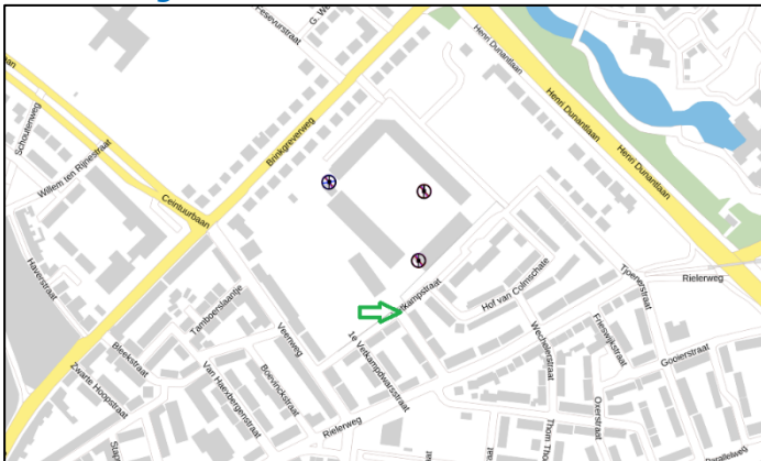
Figuur 3: Weergave van het Antenneregister

Bovenstaande afbeelding (figuur 3) is de weergave van het Antenneregister van de omgeving waar de EMV-meting heeft plaatsgevonden. In de weergave van het Antenneregister is een aantal gekleurde cirkels zichtbaar. Deze cirkels geven de opstelplaatsen van de verschillende antenne-installaties weer. Op de locatie met de zwarte, blauwe, bordeaux rode en paarse cirkels is 2G, 3G, 4G en 5G in gebruik. De licht rode cirkels zijn vaste verbindingen, ook wel point-to-point verbindingen genoemd. De signalen van vaste verbindingen zijn niet meegenomen in de metingen, omdat deze niet voorkomen op meetlocaties op de grond. Daarnaast worden de frequenties die vaste verbindingen gebruiken met andere meetapparatuur gemeten.