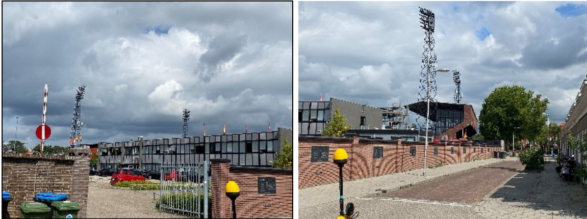
Figuur 1, en 2: Foto's van de breedbandige outdoor meetopstelling.

Op de foto's hierboven (figuur 1 en 2) is de breedbandige outdoor meetopstelling te zien. Het meetapparaat staat op straat. De dichtstbijzijnde vast opgestelde antenne-installatie is vanuit de meetlocatie te zien.