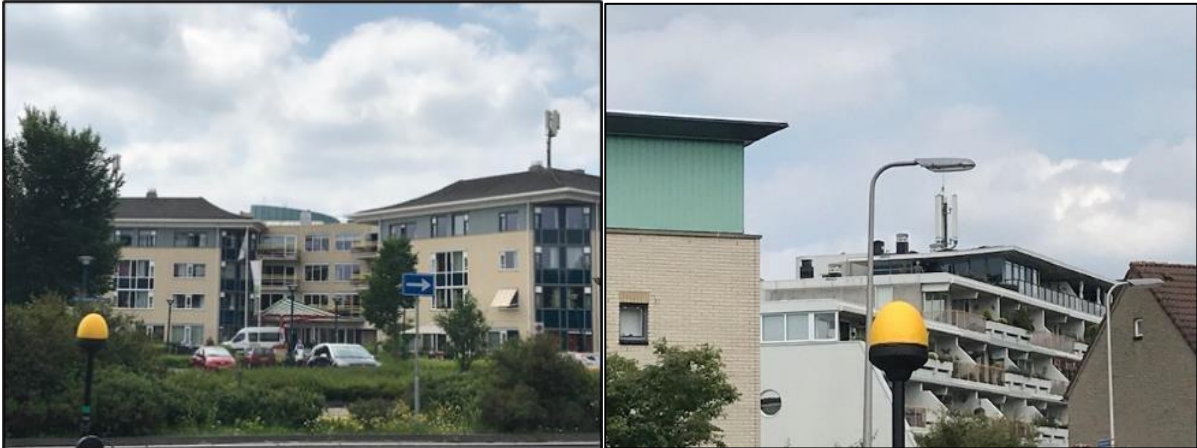
Figuur 1 en 2: Foto's van de breedbandige outdoor meetopstelling

Op de foto's hierboven (figuur 1 en 2) is de breedbandige outdoor meetopstelling te zien. Het meetapparaat staat op straat. Op de achtergrond is de dichtstbijzijnde vast opgestelde antenne-installatie te zien.