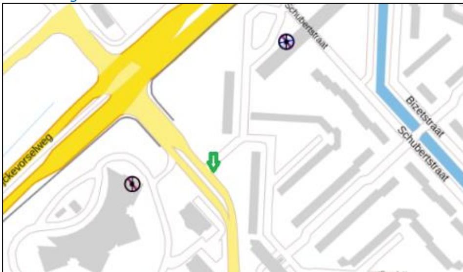
Figuur 3: Weergave van het Antenneregister

Bovenstaande afbeelding (figuur 3) is de weergave van het Antenneregister van de omgeving waar de EMV-meting heeft plaatsgevonden. In de weergave van het Antenneregister is een aantal gekleurde cirkels zichtbaar. Deze cirkels geven de opstelplaatsen van de verschillende antenne-installaties weer. Op de locatie met de zwarte, blauwe, bordeaux rode en paarse cirkels is 2G, 3G, 4G en 5G in gebruik. De rode cirkels zijn vaste verbindingen, ook wel point-to-point verbindingen genoemd. De signalen van vaste verbindingen zijn niet meegenomen in de metingen, omdat deze niet voorkomen op meetlocaties op de grond. Daarnaast worden de frequenties die vaste verbindingen gebruiken met andere meetapparatuur gemeten.