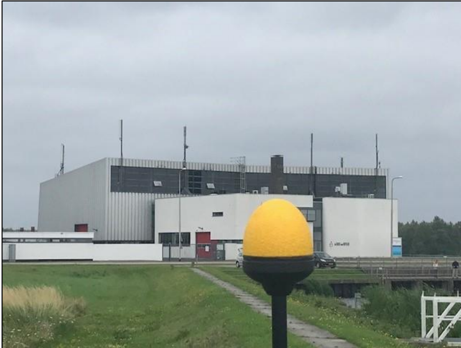
Figuur 1: Foto van de breedbandige outdoor meetopstelling

Op de foto hierboven (figuur 1) is de breedbandige outdoor meetopstelling te zien. Het meetapparaat staat op straat. De dichtstbijzijnde vast opgestelde antenne-installatie is vanuit de meetlocatie niet te zien.