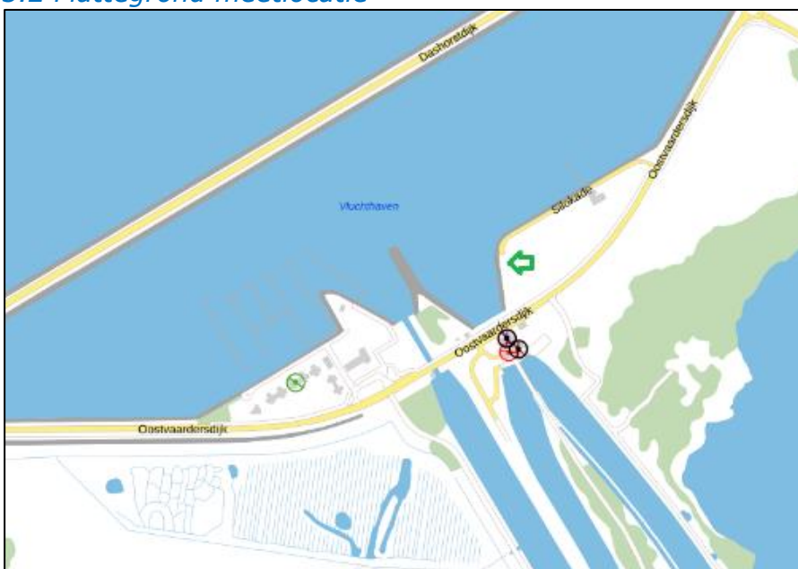
Figuur 2: Weergave van het Antenneregister