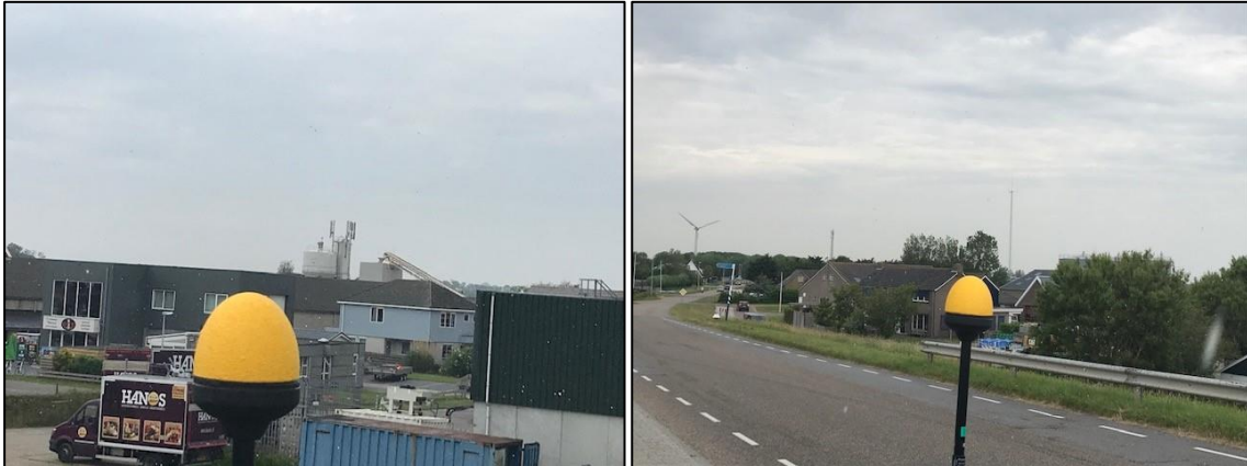
Figuur 1 en 2: Foto's van de breedbandige outdoor meetopstelling

Op de foto's hierboven (figuur 1 en 2) is de breedbandige outdoor meetopstelling te zien. Het meetapparaat staat op straat. Op de achtergrond staat de dichtstbijzijnde vast opgestelde antenne-installatie.