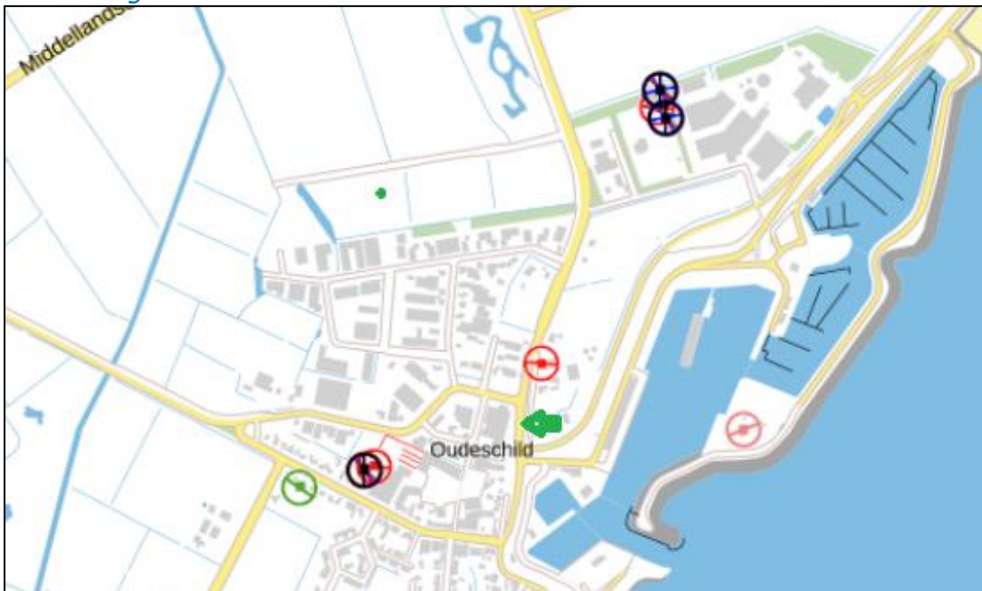
Figuur 3: Weergave van het Antenneregister

Bovenstaande afbeelding (figuur 3) is de weergave van het Antenneregister van de omgeving waar de EMV-meting heeft plaatsgevonden. In de weergave van het Antenneregister is een aantal gekleurde cirkels zichtbaar. Deze cirkels geven de opstelplaatsen van de verschillende antenne-installaties weer. Op de locatie met de zwarte, blauwe, bordeaux rode en paarse cirkels is 2G, 3G, 4G en 5G in gebruik. De licht rode is van een marifoon grondstation. De rode cirkels zijn vaste verbindingen, ook wel point-to-point verbindingen genoemd. De signalen van vaste verbindingen zijn niet meegenomen in de metingen, omdat deze niet voorkomen op meetlocaties op de grond.