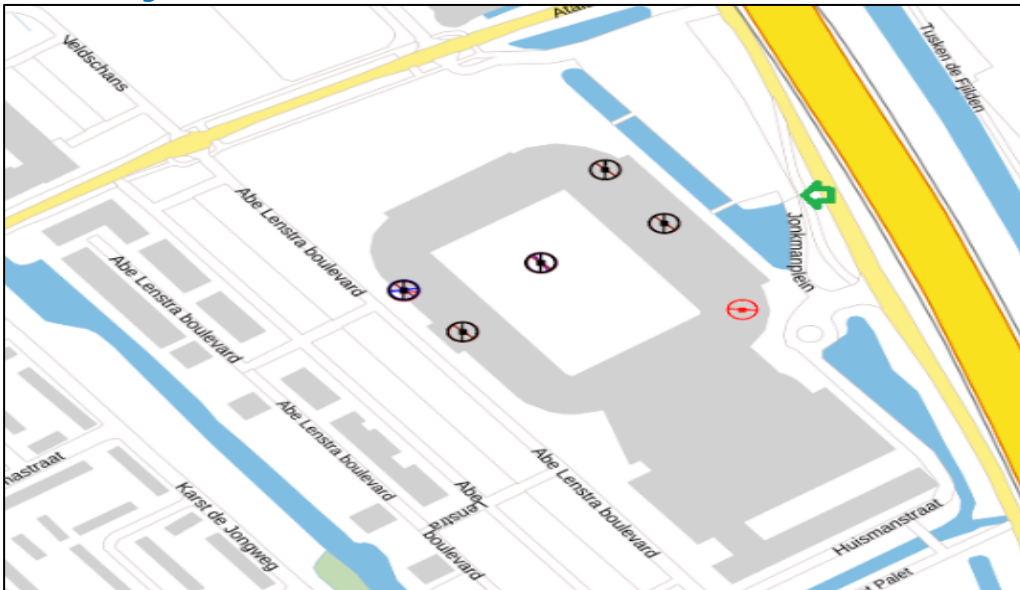
Figuur 2: Weergave van het Antenneregister

Bovenstaande afbeelding (figuur 2) is de weergave van het Antenneregister van de omgeving waar de EMV-meting heeft plaatsgevonden. In de weergave van het Antenneregister is een aantal gekleurde cirkels zichtbaar. Deze cirkels geven de opstelplaatsen van de verschillende antenne-