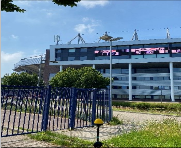
Figuur 1: Foto van de breedbandige outdoor meetopstelling.

Op de foto hierboven (figuur 1) is de breedbandige outdoor meetopstelling te zien. Het meetapparaat staat op straat. De dichtstbijzijnde vast opgestelde antenne-installatie is vanuit de meetlocatie te zien.