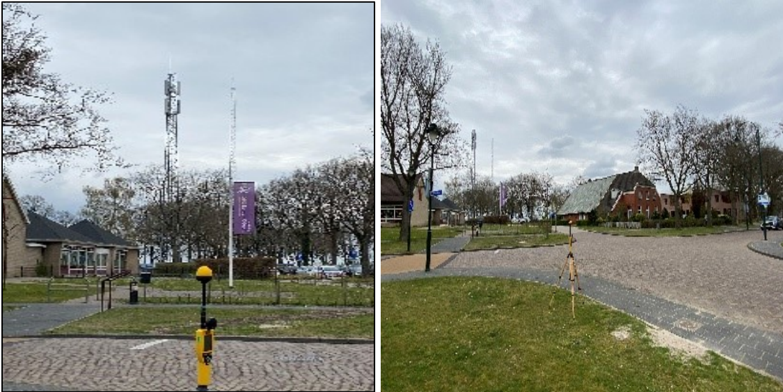
Figuur 1, en 2: Foto's van de breedbandige outdoor meetopstelling.

Op de foto's hierboven (figuur 1 en 2) is de breedbandige outdoor meetopstellingen te zien. Het meetapparaat staat op straat. De dichtstbijzijnde vast opgestelde antenne-installatie is vanuit de meetlocatie te zien.