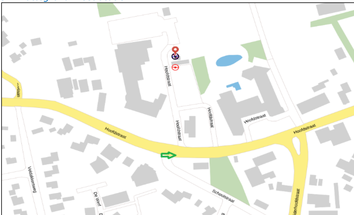
Figuur 3: Weergave van het Antenneregister