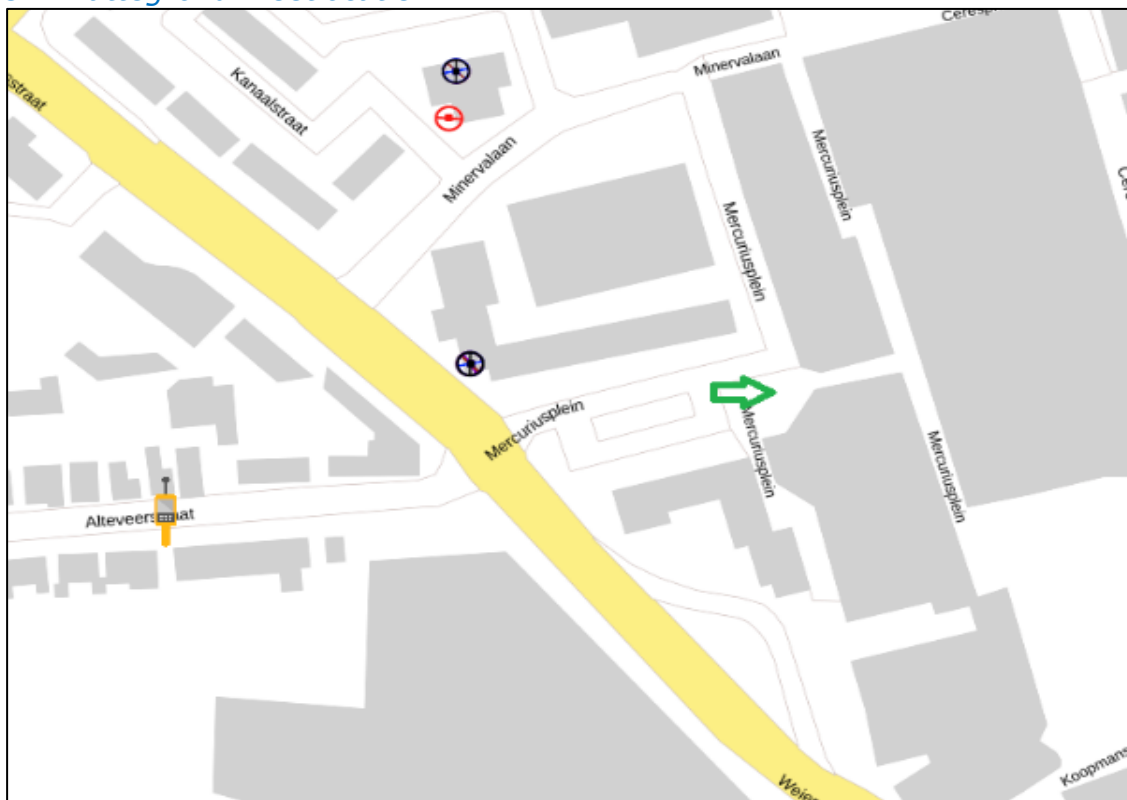
Figuur 3: Weergave van het Antenneregister