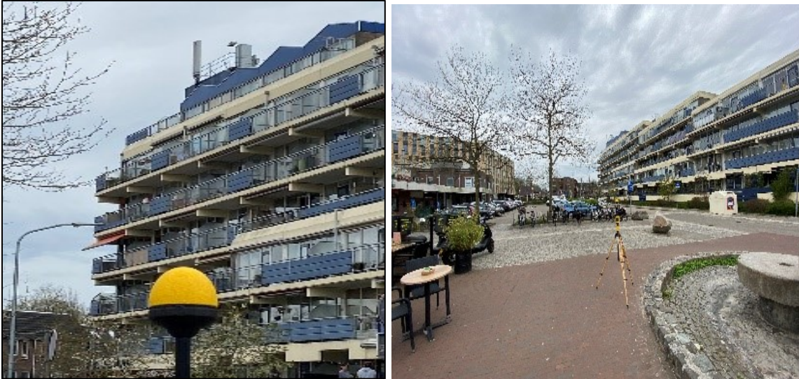
Figuur 1, en 2: Foto's van de breedbandige outdoor meetopstelling.

Op de foto's hierboven (figuur 1 en 2) is de breedbandige outdoor meetopstellingen te zien. Het meetapparaat staat op straat. De dichtstbijzijnde vast opgestelde antenne-installatie is vanuit de meetlocatie te zien.