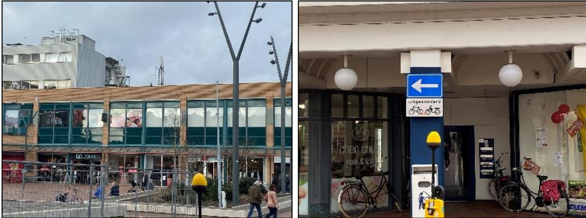
Figuur 1 en 2: Foto's van de breedbandige outdoor meetopstelling.

Op de foto's hierboven (figuur 1 en 2) is de breedbandige outdoor meetopstellingen te zien. Het meetapparaat staat op straat. De dichtstbijzijnde vast opgestelde antenne-installatie is vanuit de meetlocatie niet altijd te zien.