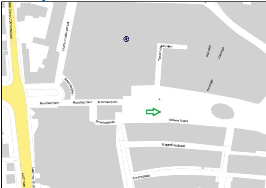
Figuur 3: Weergave van het Antenneregister

Bovenstaande afbeelding (figuur 3) is de weergave van het Antenneregister van de omgeving waar de EMV-meting heeft plaatsgevonden. In de weergave van het Antenneregister is een aantal gekleurde cirkels zichtbaar. Deze cirkels geven de opstelplaatsen van de verschillende antenne-installaties weer. Op de locatie met de zwarte, blauwe, bordeaux rode en paarse cirkels is 2G, 3G, 4G en 5G in gebruik. De licht rode cirkels zijn vaste verbindingen, ook wel point-to-point verbindingen genoemd. De signalen van vaste verbindingen zijn niet meegenomen in de metingen, omdat deze niet voorkomen op meetlocaties op de grond. Daarnaast worden de frequenties die vaste verbindingen gebruiken met andere meetapparatuur gemeten.