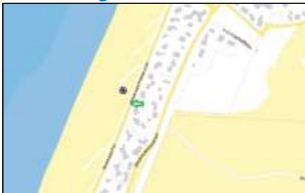
Figuur 2: Weergave van het Antenneregister

Bovenstaande afbeelding (figuur 2) is de weergave van het Antenneregister van de omgeving waar de EMV-meting heeft plaatsgevonden. In de weergave van het Antenneregister is een aantal gekleurde cirkels zichtbaar. Deze cirkels geven de opstelplaatsen van de verschillende antenne-installaties weer. Op de locatie met de zwarte, blauwe, bordeaux rode en paarse cirkels is 2G, 3G, 4G en 5G in gebruik. De rode cirkel zijn vaste verbindingen, ook wel point-to-point verbindingen genoemd. De signalen van vaste verbindingen zijn niet meegenomen in de metingen, omdat deze niet voorkomen op meetlocaties op de grond. Daarnaast worden de frequenties die vaste verbindingen gebruiken met andere meetapparatuur gemeten.