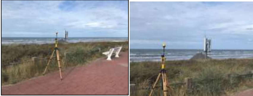
Figuur 1: Foto's van de breedbandige outdoor meetopstelling.

Op de foto's hierboven (figuur 1) is de breedbandige outdoor meetopstelling te zien. Het meetapparaat staat op de straat. Op de achtergrond staat de dichtstbijzijnde vast opgestelde antenne-installatie.