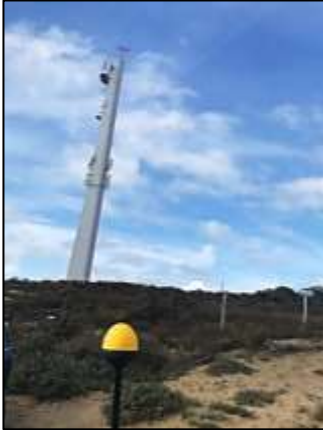
Figuur 1: Foto van de breedbandige outdoor meetopstelling.

Op de foto hierboven (figuur 1) is de breedbandige outdoor meetopstelling te zien. Het meetapparaat staat op straat. Op de achtergrond staat de dichtstbijzijnde vast opgestelde antenne-installatie.