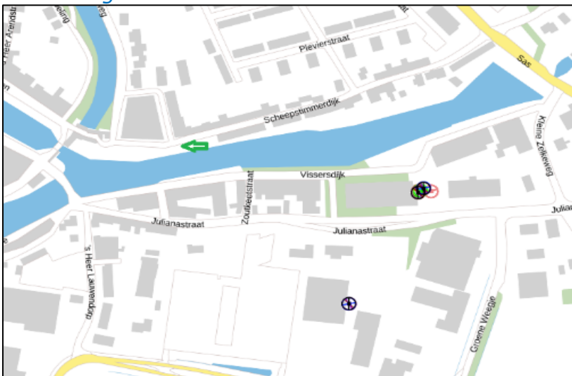
Figuur 2: Weergave van het Antenneregister

Bovenstaande afbeelding (figuur 2) is de weergave van het Antenneregister van de omgeving waar de EMV-meting heeft plaatsgevonden. In de weergave van het Antenneregister is een aantal gekleurde cirkel zichtbaar. Deze cirkels geven de opstelplaatsen van de verschillende antenne-