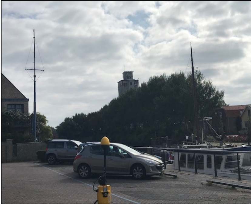
Figuur 1: Foto van de breedbandige outdoor meetopstelling

Op de foto hierboven (figuur 1) is de breedbandige outdoor meetopstelling te zien. Het meetapparaat staat op straat. De dichtstbijzijnde vast opgestelde antenne-installatie is vanuit de meetlocatie niet goed te zien.