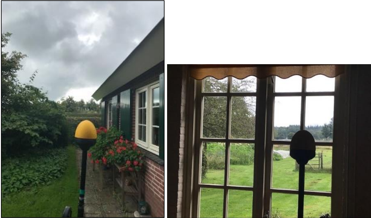
Figuur 1 en 2: Foto's van de breedbandige outdoor en indoor meetopstelling

Op de foto's hierboven (figuur 1 en 2) is de breedbandige indoor en outdoor meetopstelling te zien. Het meetapparaat staat in de voortuin en woonkamer. De dichtstbijzijnde vast opgestelde antenne-installatie is vanuit de meetlocatie niet te zien.