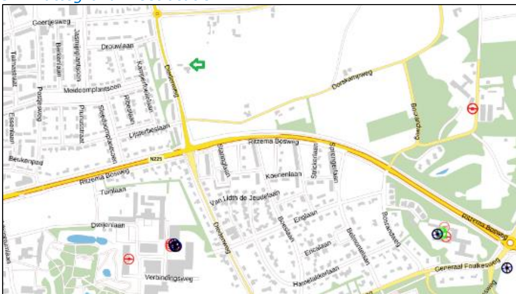
Figuur 3: Weergave van het Antenneregister