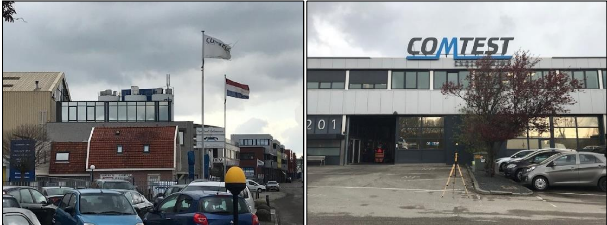
Figuur 1 en 2: Foto's van de breedbandige outdoor meetopstelling

Op de foto's hierboven (figuur 1 en 2) is de breedbandige outdoor meetopstellingen te zien. Het meetapparaat staat op straat. Op foto 1 is de achtergrond de dichtstbijzijnde vast opgestelde antenne-installatie te zien.