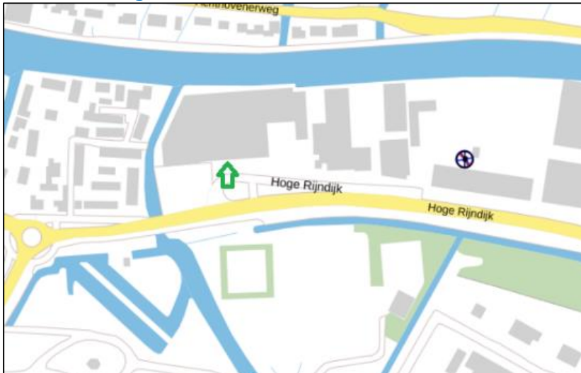
Figuur 3: Weergave van het Antenneregister

Bovenstaande afbeelding (figuur 3) is de weergave van het Antenneregister van de omgeving waar de EMV-meting heeft plaatsgevonden. In de weergave van het Antenneregister zijn een aantal gekleurde cirkels zichtbaar. Deze cirkels geven de opstelplaatsen van de verschillende antenne-installaties weer. Op de locatie met de zwarte, blauwe, bordeaux rode en paarse cirkels is 2G, 3G, 4G en 5G in gebruik. De rode cirkels zijn vaste verbindingen, ook wel point-to-point verbindingen genoemd. De signalen van vaste verbindingen zijn niet meegenomen in de metingen, omdat deze niet voorkomen op meetlocaties op de grond. Daarnaast worden de frequenties die vaste verbindingen gebruiken met andere meetapparatuur gemeten.