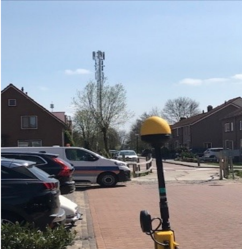
Figuur 1: Foto's van de breedbandige outdoor meetopstelling

Op de foto's hierboven (figuur 1) is de breedbandige outdoor meetopstelling te zien. Het meetapparaat staat op straat. Op de achtergrond staat de dichtstbijzijnde vast opgestelde antenne-installatie.