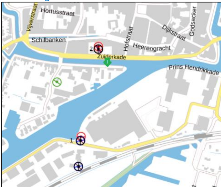
Figuur 3: Weergave van het Antenneregister

Bovenstaande afbeelding (figuur 3) is de weergave van het Antenneregister van de omgeving waar de EMV-meting heeft plaatsgevonden. In de weergave van het Antenneregister zijn een aantal gekleurde cirkels zichtbaar. Deze cirkels geven de opstelplaatsen van de verschillende antenne-installaties weer. Op de locatie met de zwarte, blauwe, bordeaux rode en paarse cirkels is 2G, 3G, 4G en 5G in gebruik. De groene cirkel is de antenne van een radiozendamateer. De rode cirkels zijn vaste verbindingen, ook wel point-to-point verbindingen genoemd. De signalen van vaste