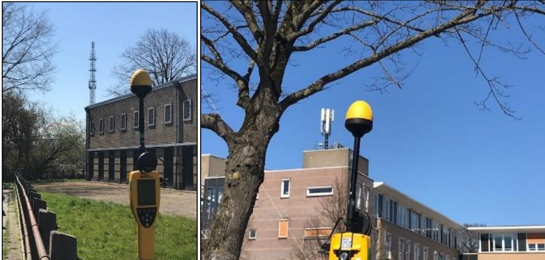
Figuur 1 en 2: Foto's van de breedbandige outdoor meetopstelling

Op de foto's hierboven (figuur 1 en 2) is de breedbandige outdoor meetopstelling te zien. Het meetapparaat staat op straat. Op de achtergrond staan de dichtstbijzijnde vast opgestelde antenne-installaties.