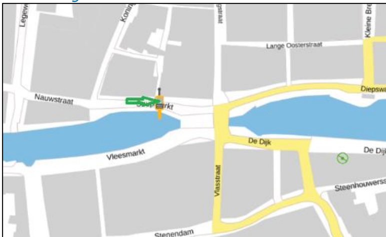
Figuur 3: Weergave van het Antenneregister

Bovenstaande afbeelding (figuur 3) is de weergave van het Antenneregister van de omgeving waar de EMV-meting heeft plaatsgevonden. In de weergave van het Antenneregister is een gekleurde cirkel zichtbaar. Deze groene cirkel is de antenne van een radiozendamateer.