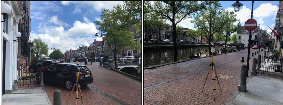
Figuur 1 en 2: Foto's van de breedbandige outdoor meetopstelling

Op de foto's hierboven (figuur 1 en 2) is de breedbandige outdoor meetopstelling te zien. Het meetapparaat staat op straat. De dichtstbijzijnde vast opgestelde antenne-installatie is vanuit de meetlocatie niet te zien.