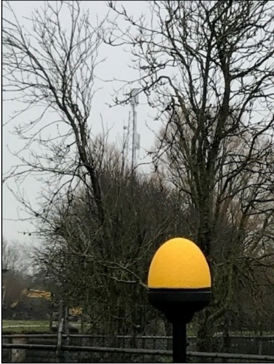
Figuur 1: Foto van de breedbandige outdoor meetopstelling

Op de foto hierboven (figuur 1) is de breedbandige outdoor meetopstelling te zien. Het meetapparaat staat op het plein. Op de achtergrond staat de dichtstbijzijnde vast opgestelde antenne-installatie.