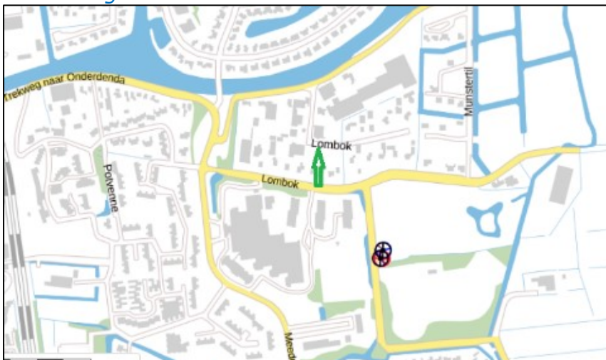
Figuur 2: Weergave van het Antenneregister

Bovenstaande afbeelding (figuur 2) is de weergave van het Antenneregister van de omgeving waar de EMV-meting heeft plaatsgevonden. In de weergave van het Antenneregister zijn een aantal gekleurde cirkels zichtbaar. Deze cirkels geven de opstelplaatsen van de verschillende antenne-