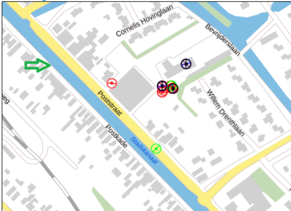
Figuur 2: Weergave van het Antenneregister

Bovenstaande afbeelding (figuur 2) is de weergave van het Antenneregister van de omgeving waar de EMV-meting heeft plaatsgevonden. In de weergave van het Antenneregister zijn een aantal gekleurde cirkels zichtbaar. Deze cirkels geven de opstelplaatsen van de verschillende antenne-installaties weer. Op de locatie met de zwarte, blauwe, bordeaux rode en paarse cirkels is 2G, 3G, 4G, 5G, semafoon in gebruik. De lichtgroene cirkels zijn van AM/FM-omroep. De rode cirkels zijn vaste verbindingen, ook wel point-to-point verbindingen genoemd. De signalen van vaste verbindingen zijn niet meegenomen in de metingen omdat deze niet voorkomen op meetlocaties op de grond. Daarnaast worden de frequenties die vaste verbindingen gebruiken met andere meetapparatuur gemeten.