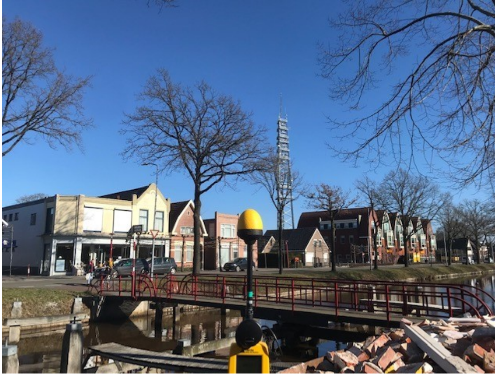
Figuur 1: Foto van de breedbandige outdoor meetopstelling

Op de foto hierboven (figuur 1) is de breedbandige outdoor meetopstelling te zien. Het meetapparaat staat op een grasveld. Op de achtergrond staat de dichtstbijzijnde vast opgestelde antenne-installatie.