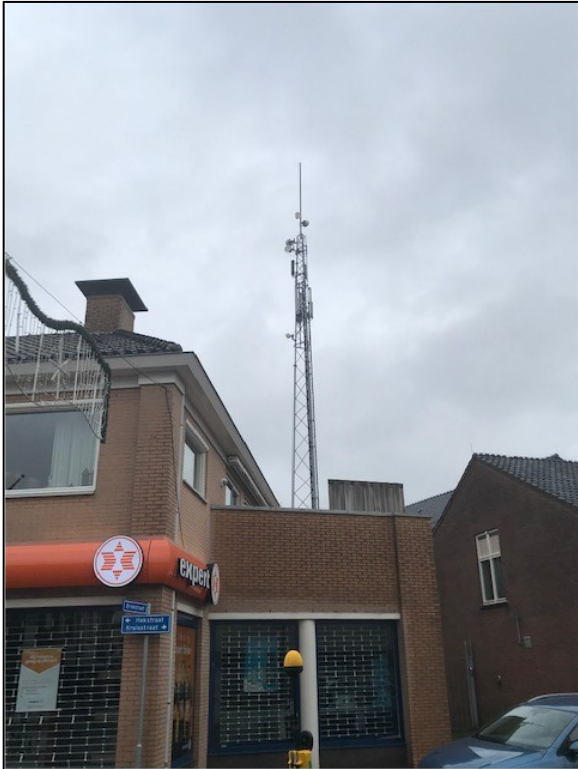
Figuur 1: Foto van de breedbandige outdoor meetopstelling

Op de foto hierboven (figuur 1) is de breedbandige outdoor meetopstelling te zien. Het meetapparaat staat op straat in de plaats Beilen. Op de achtergrond staat de dichtstbijzijnde vast opgestelde antenne-installatie.