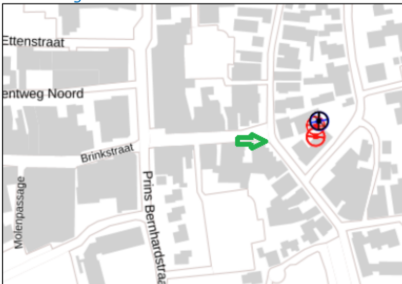
Figuur 2: Weergave van het Antenneregister