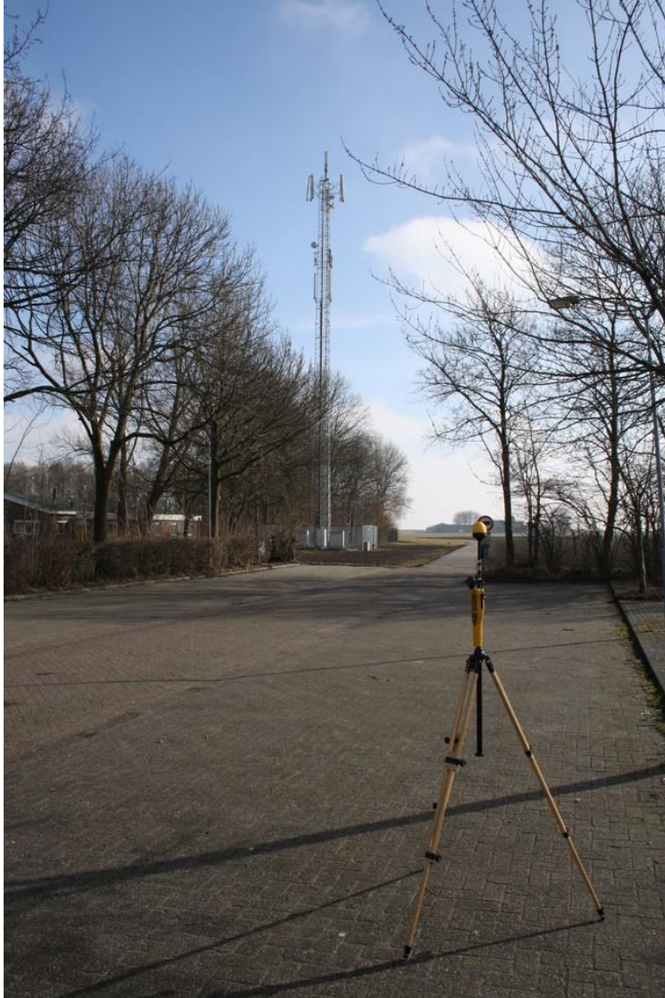
Foto 2: Opstelpunt breedbandige meting parkeerplaats voetbal vereniging WEO aan de Burgemeester Garreltsweg te Woldendorp.

De selectieve veldsterktemeting is op dezelfde locatie en op hetzelfde moment uitgevoerd als de breedbandige meting.