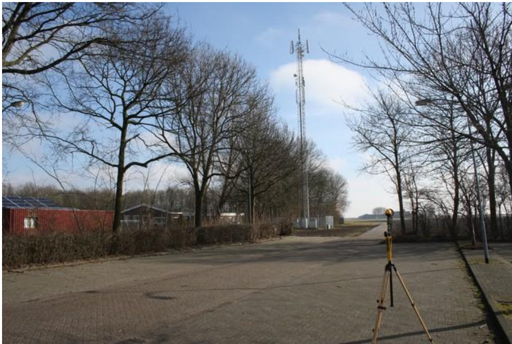
Foto 1: Opstelpunt breedbandige meting parkeerplaats voetbal vereniging WEO aan de Burgemeester Garreltsweg te Woldendorp.

De breedbandige meting is gedaan door Toezicht Agentschap Telecom.