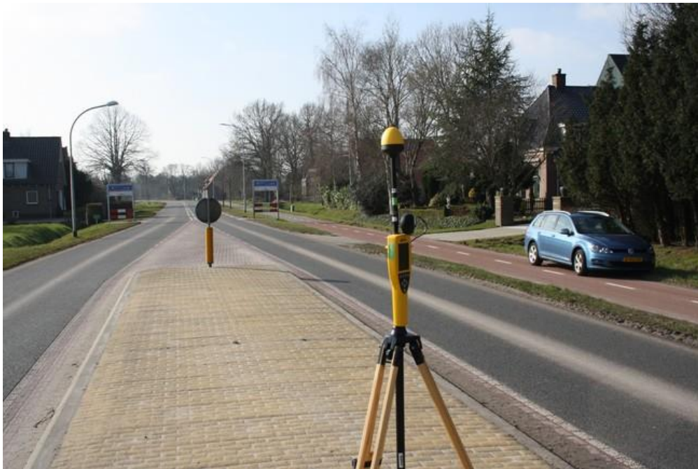
Foto 1: Opstelpunt breedbandige meting openbare weg Hoofdweg thv. nr. 82 te Nijensleek.

De breedbandige meting is gedaan door Toezicht Agentschap Telecom.