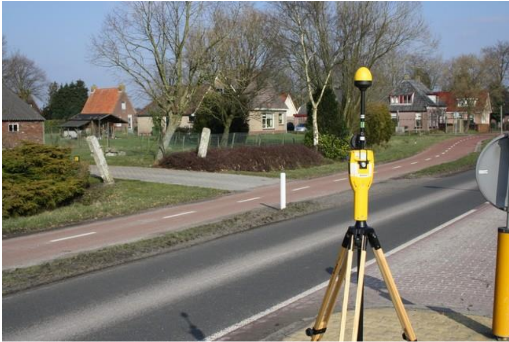
Foto 2: Opstelpunt selectieve meting openbare weg Hoofdweg thv. nr. 82 te Nijensleek.

De selectieve veldsterktemeting is op dezelfde locatie en op hetzelfde moment uitgevoerd als de breedbandige meting.