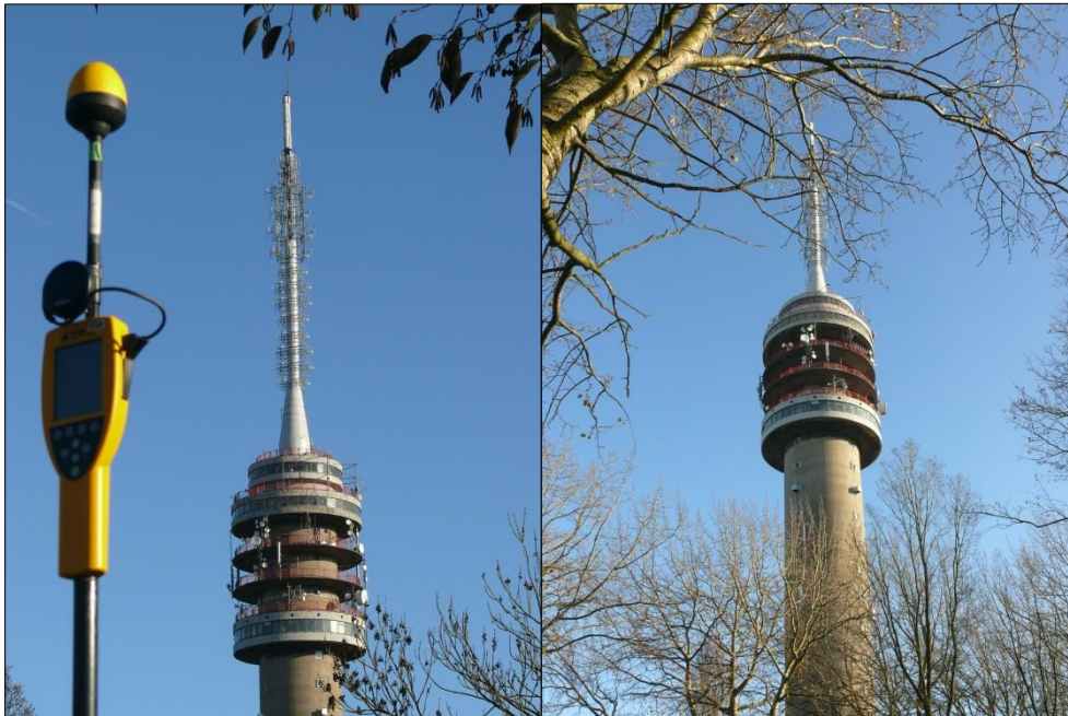
Foto 2 en 3: Opstelpunt selectieve meting De Savornin Lohmanstraat/Oudhof.

De selectieve veldsterkte meting is eveneens op verzoek van de afdeling Toezicht van Agentschap Telecom gedaan en is op dezelfde locatie en op hetzelfde moment uitgevoerd als de breedbandige meting.