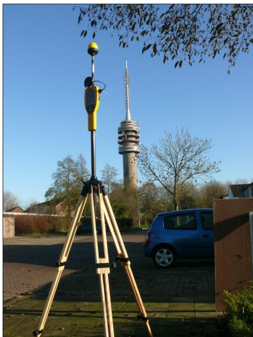
Foto 1: Opstelpunt breedbandige meting De Savornin Lohmanstraat/Oudhof.

De breedbandige meting is gedaan op verzoek van de afdeling Toezicht van Agentschap Telecom.