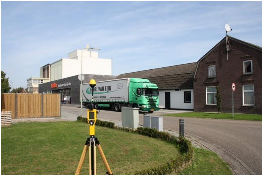
Foto 2: Opstelpunt selectieve meting openbare weg Kerkweg thv perceel 12 te Ysselstein.

De selectieve veldsterkte meting betreft de zelfde meting op verzoek van Toezicht Agentschap Telecom en is op dezelfde locatie en op hetzelfde moment uitgevoerd als de breedbandige meting.