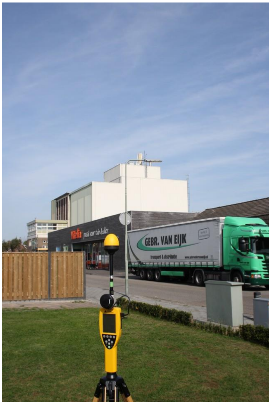
Foto 1: Opstelpunt breedbandige meting openbare weg Kerkweg thv perceel 12 te Ysselstein.

De breedbandige meting is gedaan op verzoek van Toezicht Agentschap Telecom.