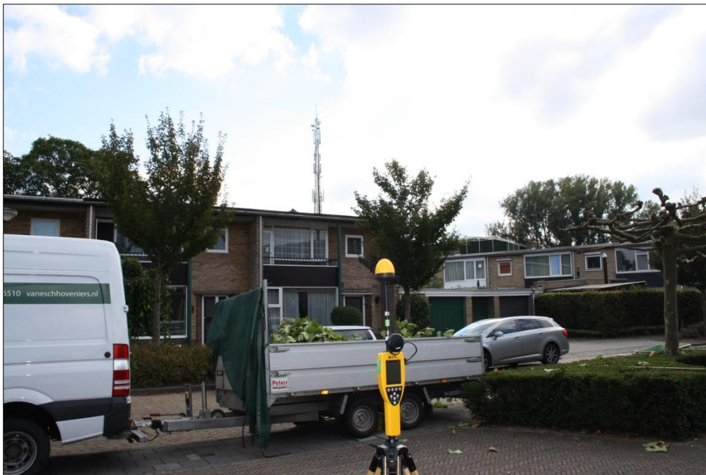
Foto 1: Opstelpunt breedbandige meting parkeerplaats Sint Joachim & Anna, BrabantZorg, Hertogin Johannastraat 26 te Veghel.

De breedbandige meting is gedaan op verzoek van Toezicht Agentschap Telecom.