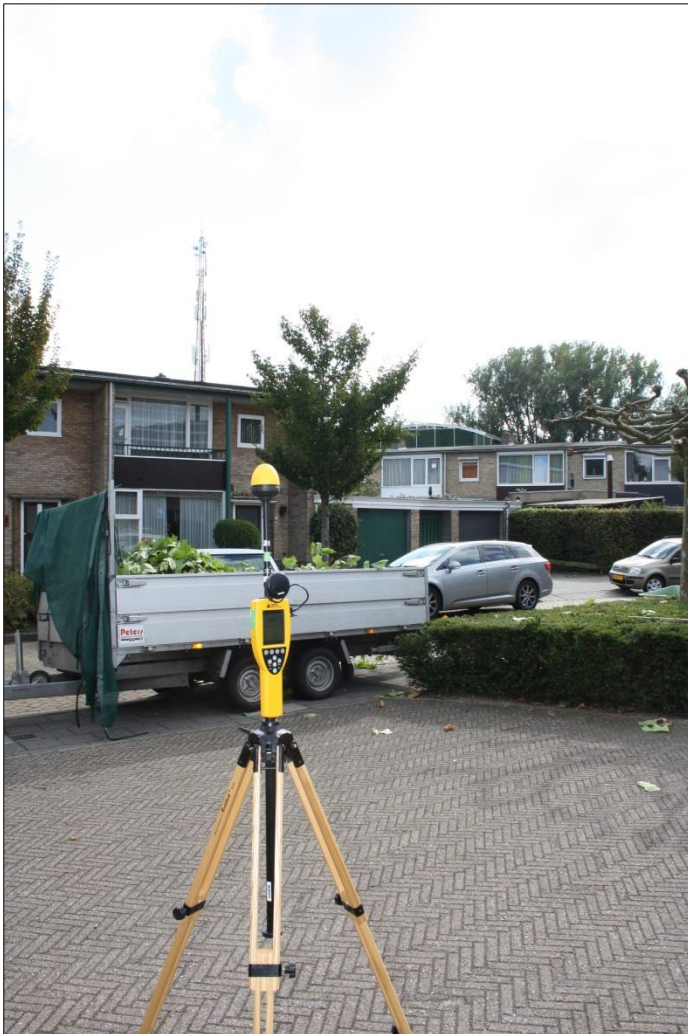
Foto 2: Opstelpunt selectieve meting parkeerplaats Sint Joachim & Anna, Brabant zorg, Hertogin Johannastraat 26 te Veghel.

De selectieve veldsterkte meting betreft de zelfde meting op verzoek van Toezicht Agentschap Telecom en is op dezelfde locatie en op hetzelfde moment uitgevoerd als de breedbandige meting.