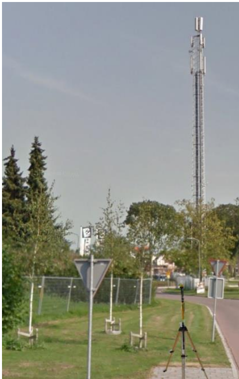
Foto 2: Opstelpunt selectieve meting openbare weg Debbeshoek kruising Weg achter de Blenk.

De selectieve veldsterkte meting betreft de zelfde meting op verzoek van Toezicht Agentschap Telecom en is op dezelfde locatie en op hetzelfde moment uitgevoerd als de breedbandige meting.