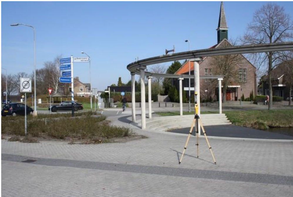
Foto 1: Opstelpunt breedbandige meting Emslandweg thv perceel 55 te Zwartemeer.

De breedbandige meting is gedaan op verzoek van Toezicht Agentschap Telecom.