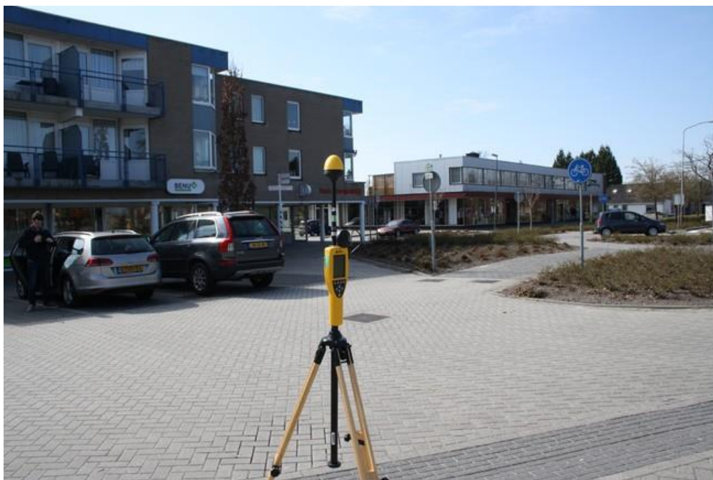
Foto 2: Opstelpunt selectieve meting Emslandweg thv perceel 55 te Zwartemeer.

De selectieve veldsterkte meting betreft de zelfde meting op verzoek van Toezicht Agentschap Telecom en is op dezelfde locatie en op hetzelfde moment uitgevoerd als de breedbandige meting.