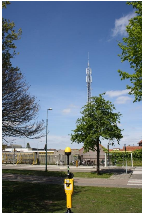
Foto 2 en 3: Opstelpunt selectieve meting Kolkkamp thv. perceel 48. Foto 2 antenne FM omroep en foto 3 antennes telecom.