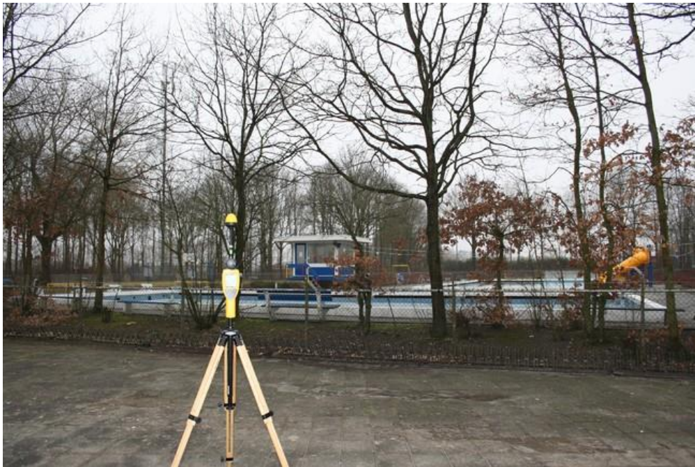
Foto 2: Opstelpunt selectieve meting Weerdinghelaan thv zwembad te Onstwedde.

De selectieve veldsterkte meting betreft de zelfde meting op verzoek van Toezicht Agentschap Telecom en is op dezelfde locatie en op hetzelfde moment uitgevoerd als de breedbandige meting.