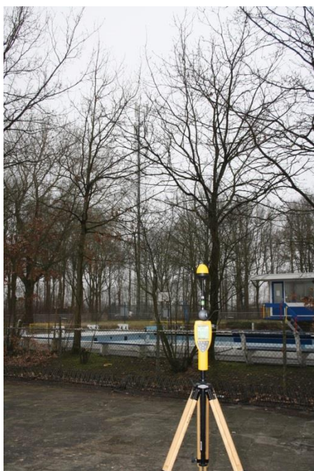
Foto 1: Opstellpunt breedbandige meting parkeerplaats Weerdinghelaan thv. zwembad te Onstwedde.

De breedbandige meting is gedaan op verzoek van Toezicht Agentschap Telecom.