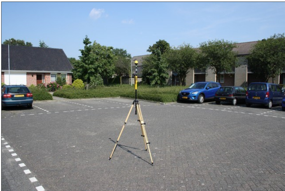
Foto 1: Opstelpunt breedbandige meting parkeerplaats / pleintje Zilveramid - Leerlooier.

De breedbandige meting is gedaan op verzoek van Toezicht Agentschap Telecom.