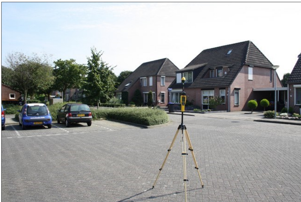
Foto 2: Opstelpunt selectieve meting parkeerplaats / pleintje Zilversmid - Leerlooier.

De selectieve veldsterkte meting is eveneens op verzoek van Toezicht Agentschap Telecom en is op dezelfde locatie en op hetzelfde moment uitgevoerd als de breedbandige meting.