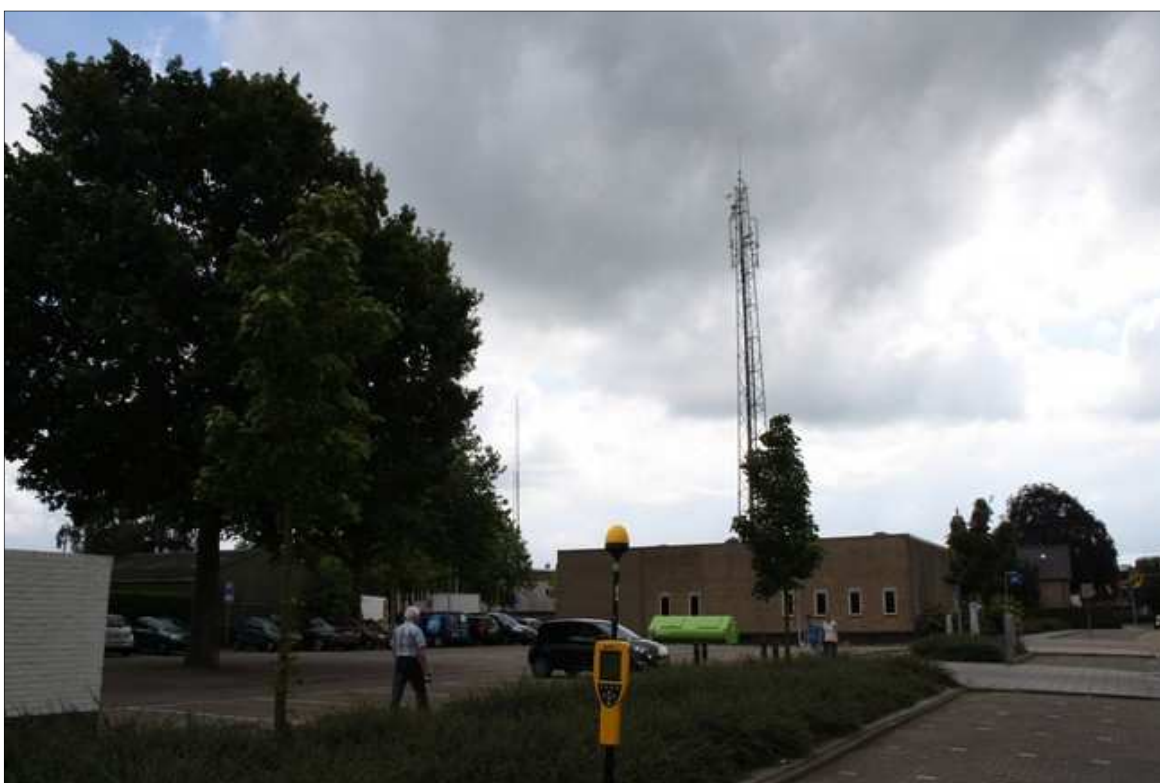
Foto 2; Meetlocatie openbare weg Schapenstraat thv de Schoolstraat.

De meetonzekerheid van het gebruikte meetinstrument is maximaal -3,7 dB en +2,6 dB. Dit betekent dat de gemeten niveaus maximaal 35 % lager en 36 % hoger kunnen zijn dan de geregistreerde waarden.