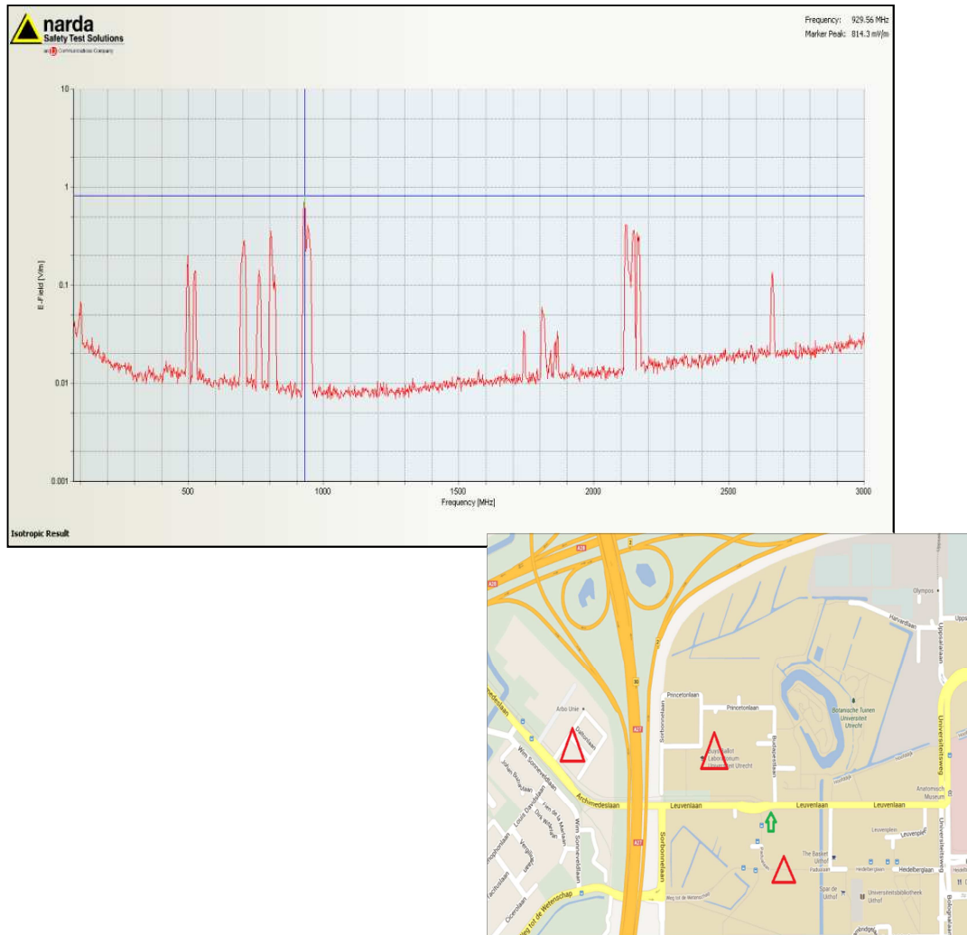
Figuur 2; De groene pijl geeft de meetlocatie aan. De rode driehoeken zijn de locaties van de in de omgeving staande GSM basisposten.