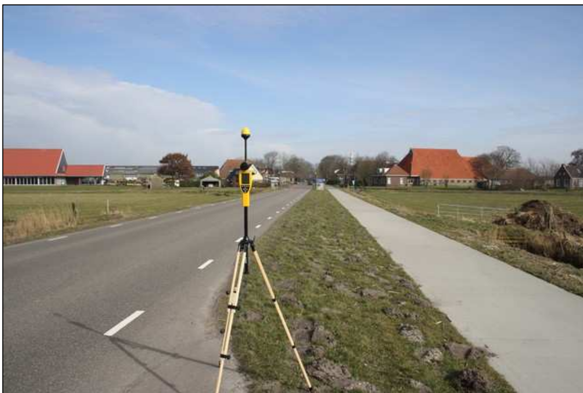
Foto 2; Meetopstelling openbare weg Gaestdijk ter hoogte van De Koai

De meetonzekerheid van het gebruikte meetinstrument is maximaal -3,7 dB en +2,6 dB. Dit betekent dat de gemeten niveaus maximaal 35 % lager en 36 % hoger kunnen zijn dan de geregistreerde waarden.