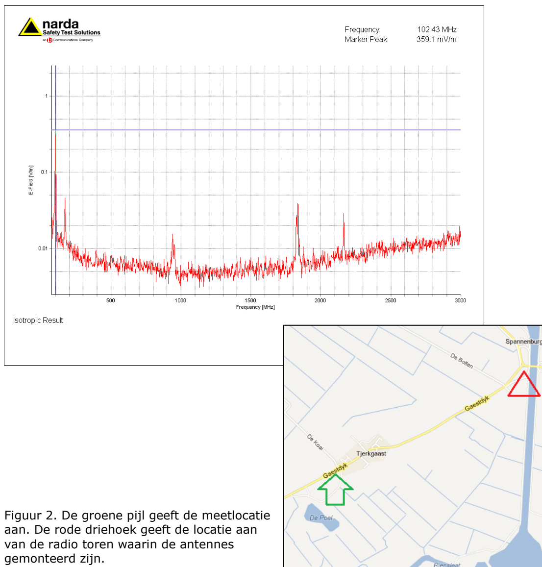
Figuur 2. De groene pijl geeft de meetlocatie aan. De rode driehoek geeft de locatie aan van de radio toren waarin de antennes gemonteerd zijn.