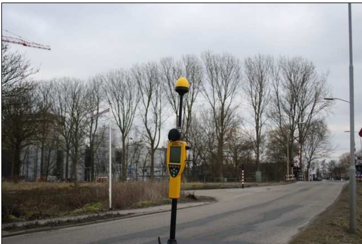
Foto 2. Meetopstelling openbare weg Boterdiep WZ kruising Parallelweg te Bedum.

De meetonzekerheid van het gebruikte meetinstrument is maximaal -3,7 dB en +2,6 dB. Dit betekent dat de gemeten niveaus maximaal 35 % lager en 36 % hoger kunnen zijn dan de geregistreerde waarden.