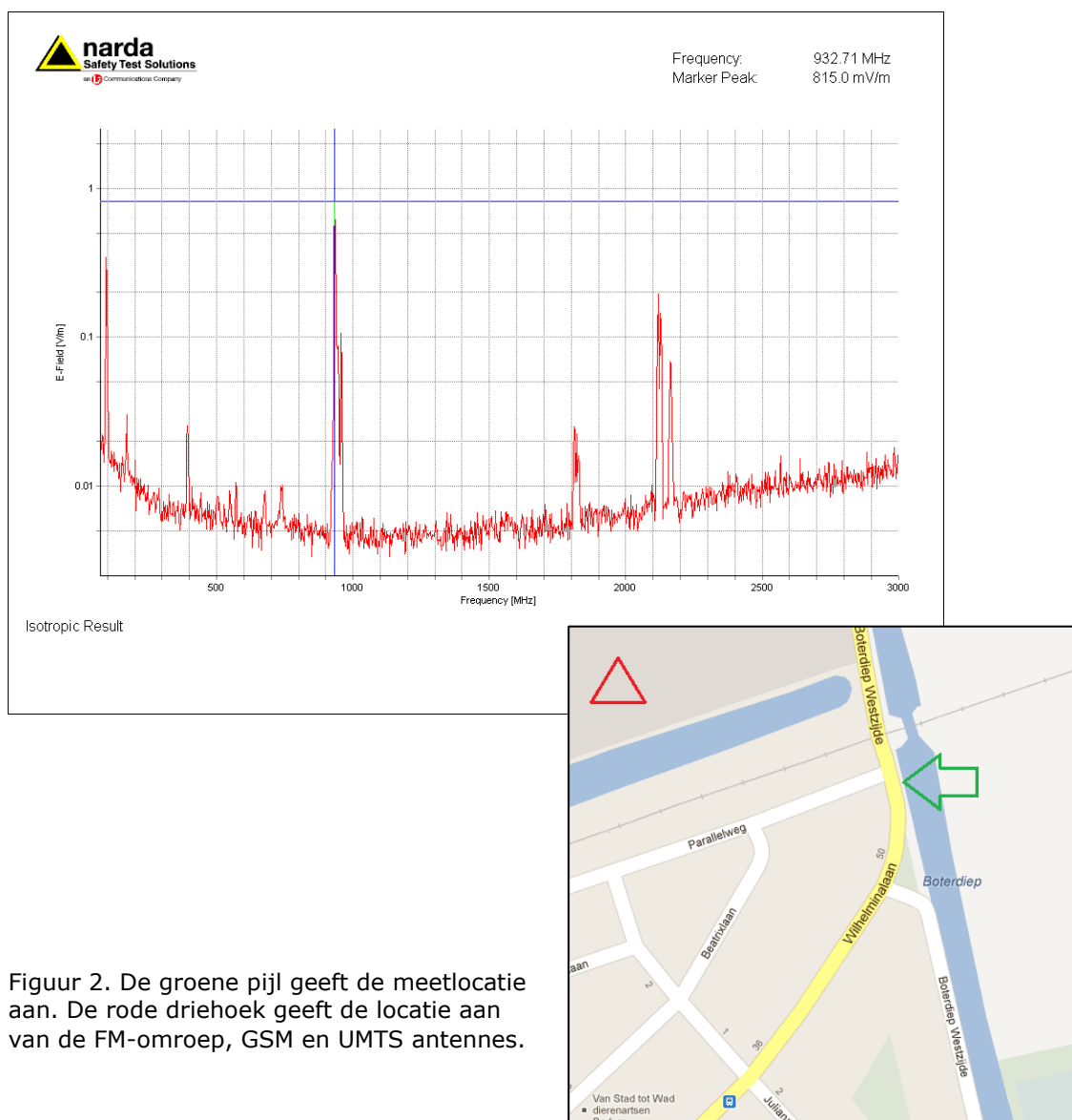
Figuur 2. De groene pijl geeft de meetlocatie aan. De rode driehoek geeft de locatie aan van de FM-omroep, GSM en UMTS antennes.