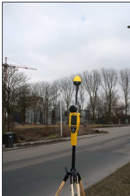
Foto 1: Meetopstelling kruising Parallelweg, Boterdiep West Zijde.