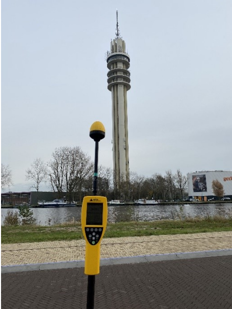
Figuur 1: Foto van de breedbandige outdoor meetopstelling in de tuin

Op de foto hierboven (figuur 1) is de breedbandige outdoor meetopstelling te zien. Het meetapparaat staat in de tuin aan de straat Noordeinde in de plaats Wormerveer. Op de achtergrond staat de dichtstbijzijnde vast opgestelde antenne-installatie (Communicatietoren Wormer)