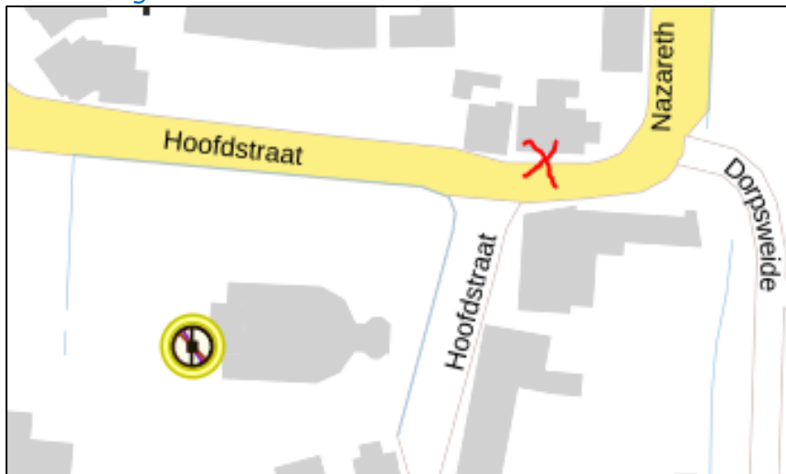
Figuur 2: Weergave van het Antenneregister